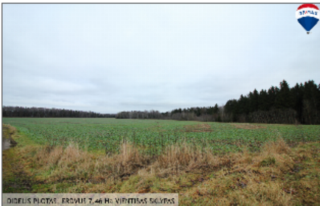
DIDĒLĪS PĻŌTĀS, ERDVIJĒS 7,46 HĀ, VIENTĪSĀS SĪKĻĪS