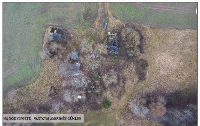
NA SODYĒVĪTĒ, PASTĀTĀI AWRĪNĒS SŌNĻĒS