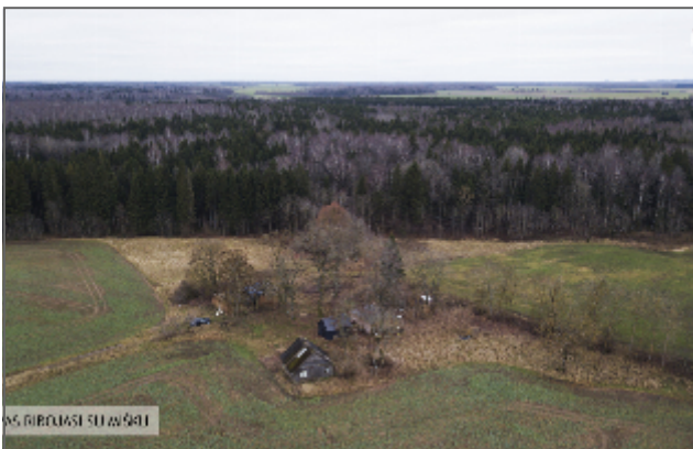
55. RIBUŠĀSI SUVAŠŅI