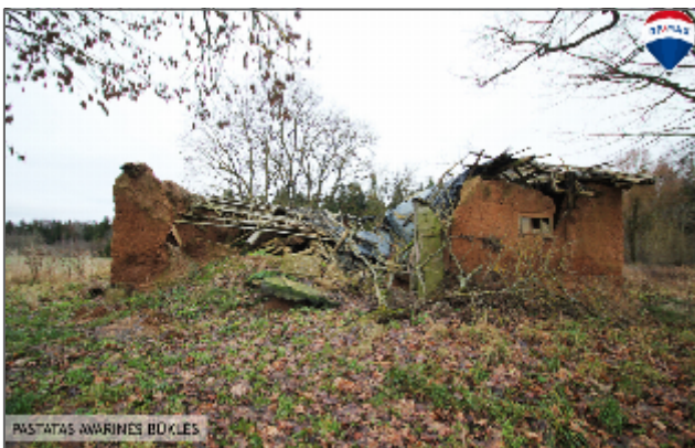
PĀSTĀTĀS ĀWRĪNĒS BŪKĻĒS