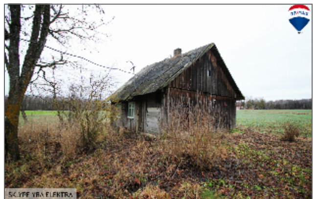
SĪKĻĪE VĪRĀ ELĒKTRĀS