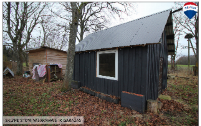
SĪKĻĪE STŌVĪ VĀSĀRNĀMĪS IR GĀRĀŽĀS