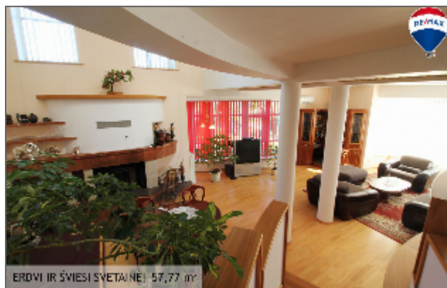
ERDVI IR ŠVIESI SVETAINĖ | 57,77 m 2