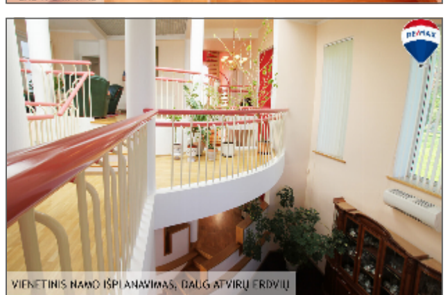
VIENETINIS NAMO IŠPIANAVIMAS, DAUG ATVIRŲ ERDVIŲ