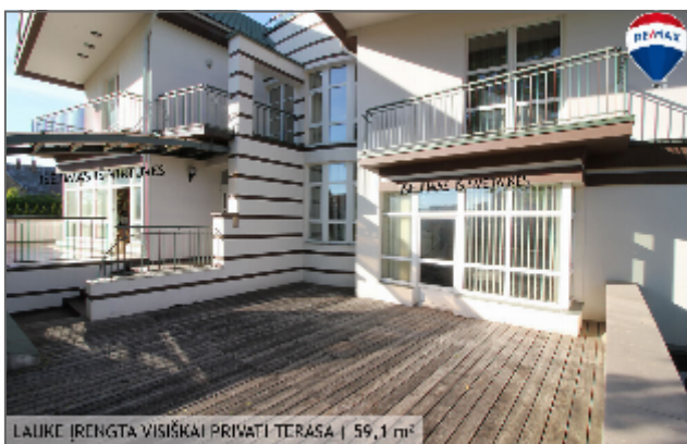
LAUKI ĮRENGTA VISIŠKAI PRIVATI TERASA | 59,1 m 2