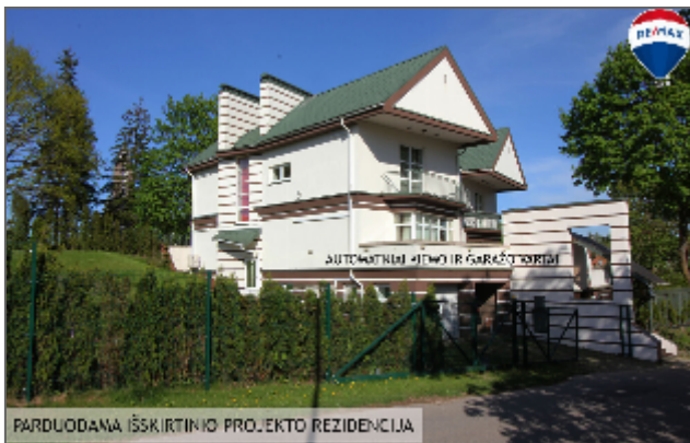
PARDUODAMA IŠSKIRTINIO PROJEKTO REZIDENCIJA