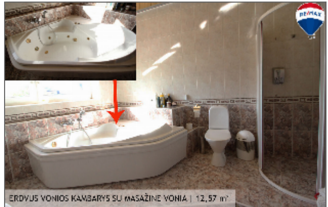
ERDVUS VONIOS KAMBARYS SU MASAŽINE VONIA | 12,57 m 2