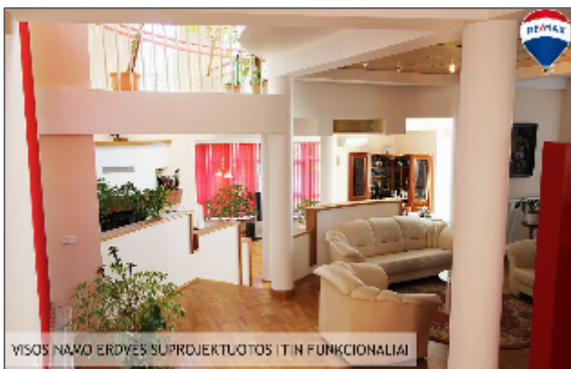
VISOS NAMO ERDVĖS SUPROJEKTUOTOS ITIN FUNKCIONALIAI