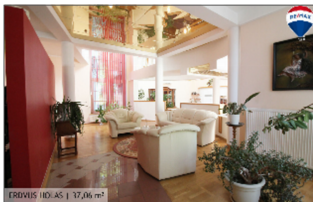
ERDVIUS HOLIDAS | 37,06 m 2