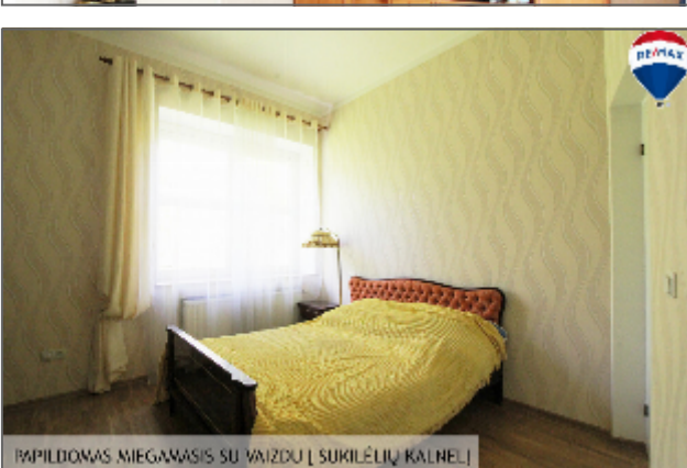
PAPILDOMAS MIEGAMASIS SU VAIZDU | SUKILĖLIŲ KALNELIŲ