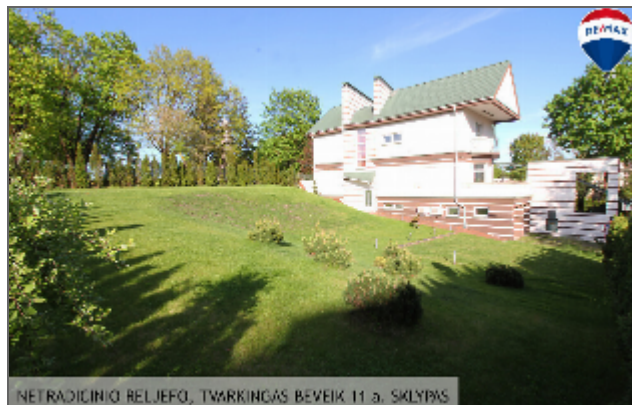
NETRADICINIO RELJEFO, TVARKINGAS BEVEIK 11 a. SKLYPAS