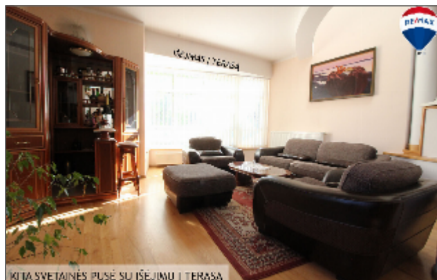
KITA SVETAINĖS PUSĖ SU IŠEJIMU Į TERASĄ