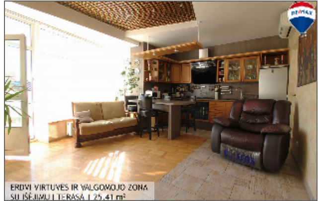
ERDVI VIRTUVES IR VALGOMOJO ZONA SU IŠĖJIMU | TERASA | 25,41 m 2