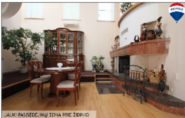
LAUKI PASISĖDĖJIMŲ ZONA PRIE ŽIDINIO