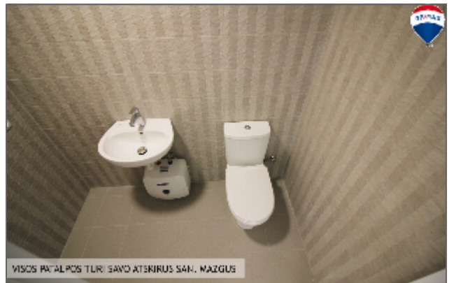
VISOS PATALPOS TURI SAVO ATSEKIRUS SAN. MAŽGUS