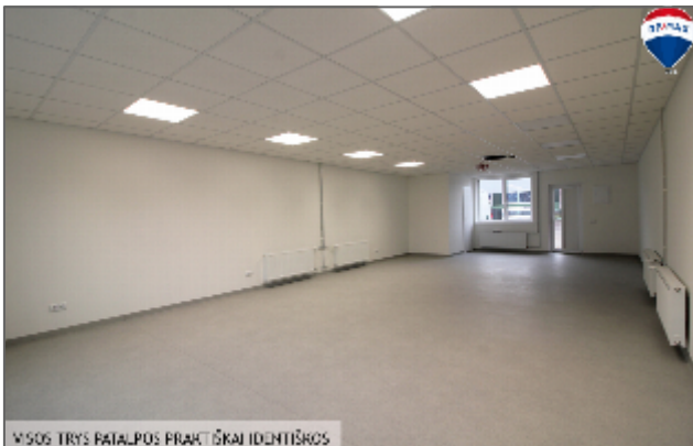
VISOS TRYS PATALPOS PRAKTIŠKAI IDENTIŠKOS