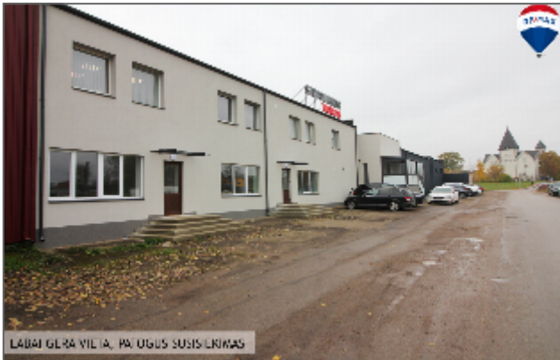
LABAI GERA VILTA, PAUOGUS SUSISUKIMAS