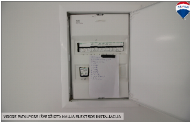
VISOSE PATALPOSE ĮŠVEDŽIOTA NAUJA ELEKTROS INSTALJACIJA