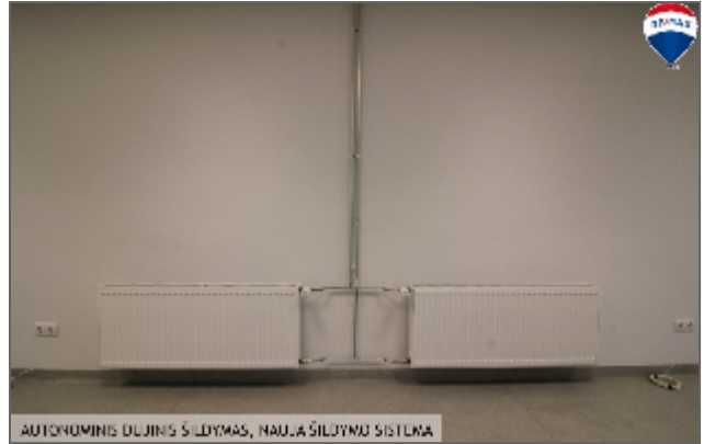
AUTONOMINIS DUJINIS ŠILDYMAS, NAUJA ŠILDYMO SISTEMA