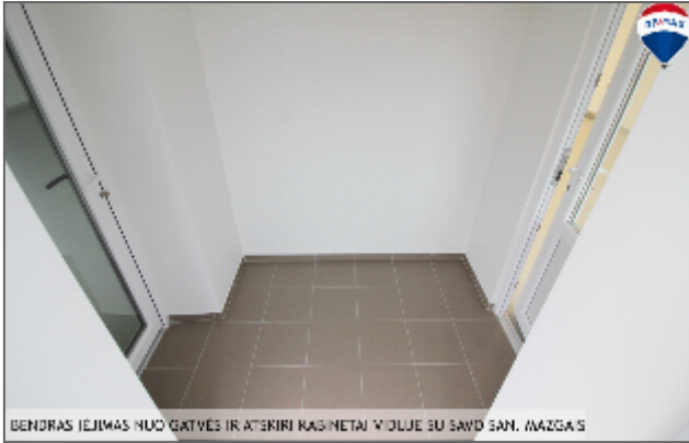
BENDRAS ĮEJIMAS NUO GATVĖS IR ATKIRTI KABINETAI VIOLUJE SU SAVO SAN. MAŽGAS