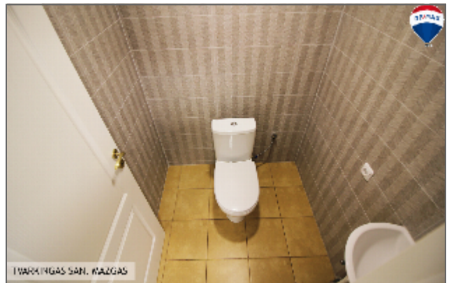
ĮVARKINGAS SAN. MAŽGAS