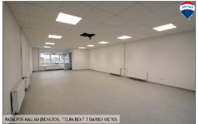
PATALPOS NAUJAI ĮRENGTOS, TELPA BENT 7 DARBO VIETOS