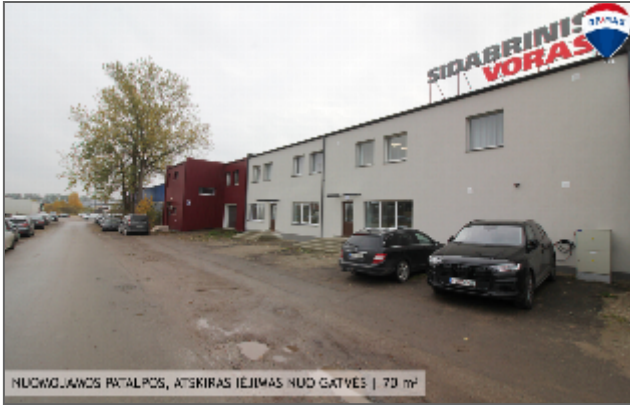
NUOGLAUKOS PATALPOS, ATĖKIRAS IĖJIMAS NUO GATVĖS | 79 m 2