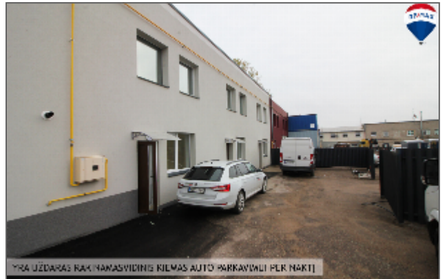
YRA JĖDARAS RAK NAMAVYDINGIŲ KILMAS AUTO PARKAVIMUI PER NAKTĮ