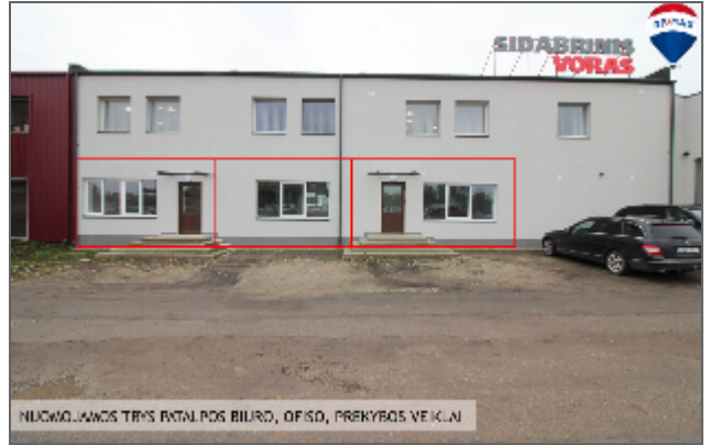
NUOGLAUKOS TRYS PATALPOS BIURO, OFISO, PREKYBOS VEIKLAI