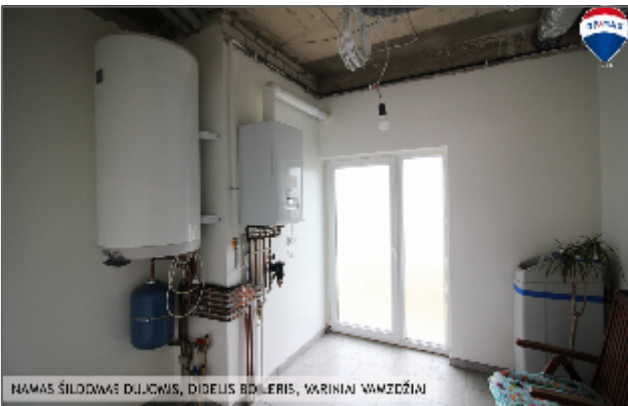
NAMAS ŠILDOMAS DUKOMIS, DIDELIS BŪLERIS, VARINIAI VAMZDŽIAI