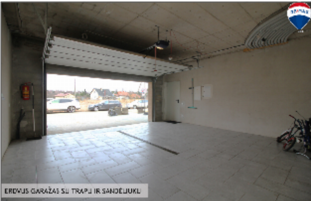
ERDVIS GARŽAS SU TRAPIJ IR SANDĖLIUKU