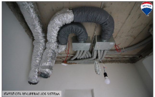
IŠVĖŽIOTA REKUPERACIJOS SISTEMA