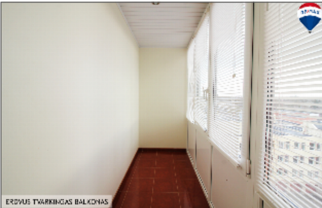
ERDVUS TVARINGAS BALKONAS