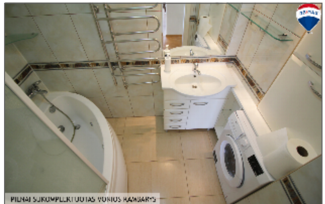
PILNAI SUKUMPLIKTUOTAS VONIUS KAMBARTS