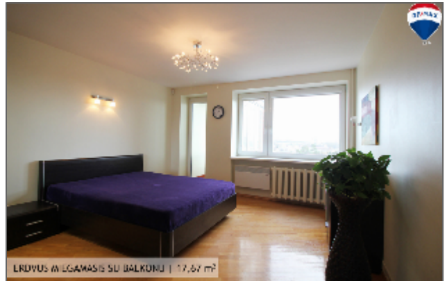
ERDVUS WILGAMASIS SU BALKONU | 17,67 m 2