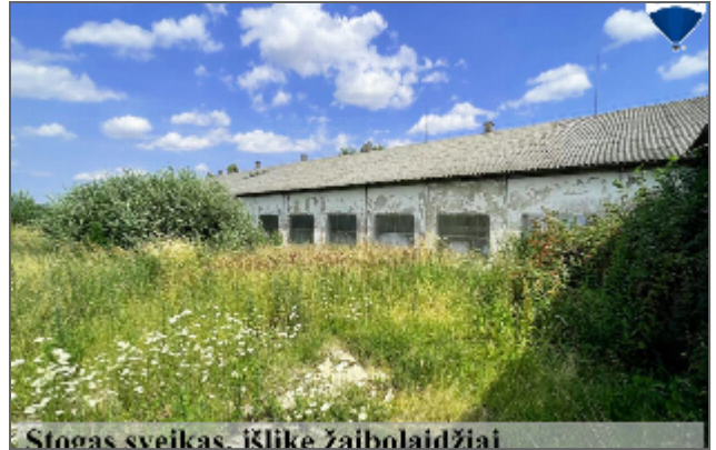
Stogas sveikas, išklike žaibolaidžiai