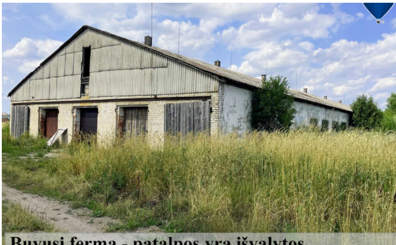
Buvusi ferma - patalpos yra išvalytos