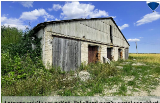
Antroame patalpa yra palūvi. Dėloliams daroma vartai, nor siduri