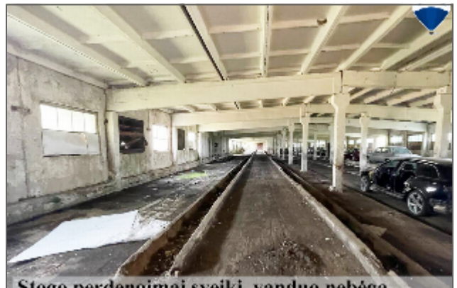
Stogo perdavimo mai sveiki vanduo nebėga