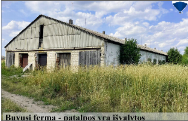
Buvusi ferma - patalpos yra išvalytos