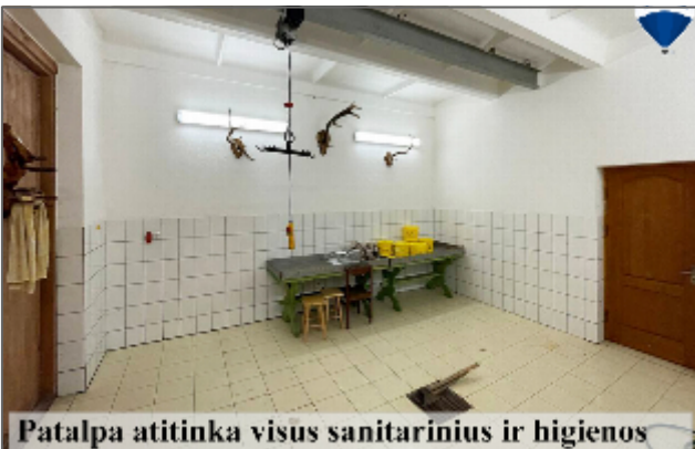
Patalpa atitinka visus sanitarinius ir higienos