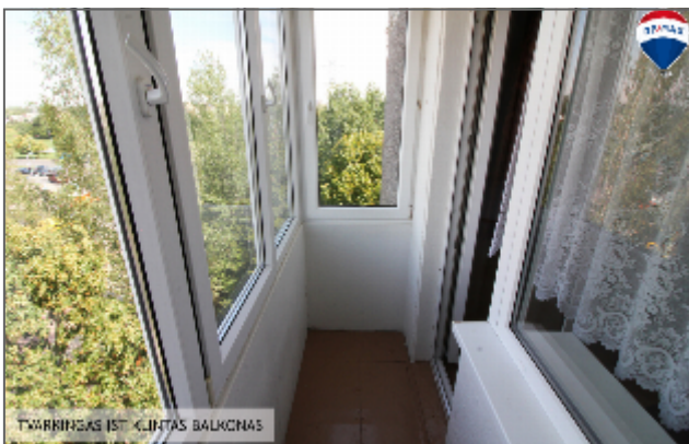
TVARRINGAS ISTOKINTAS BALKONAS