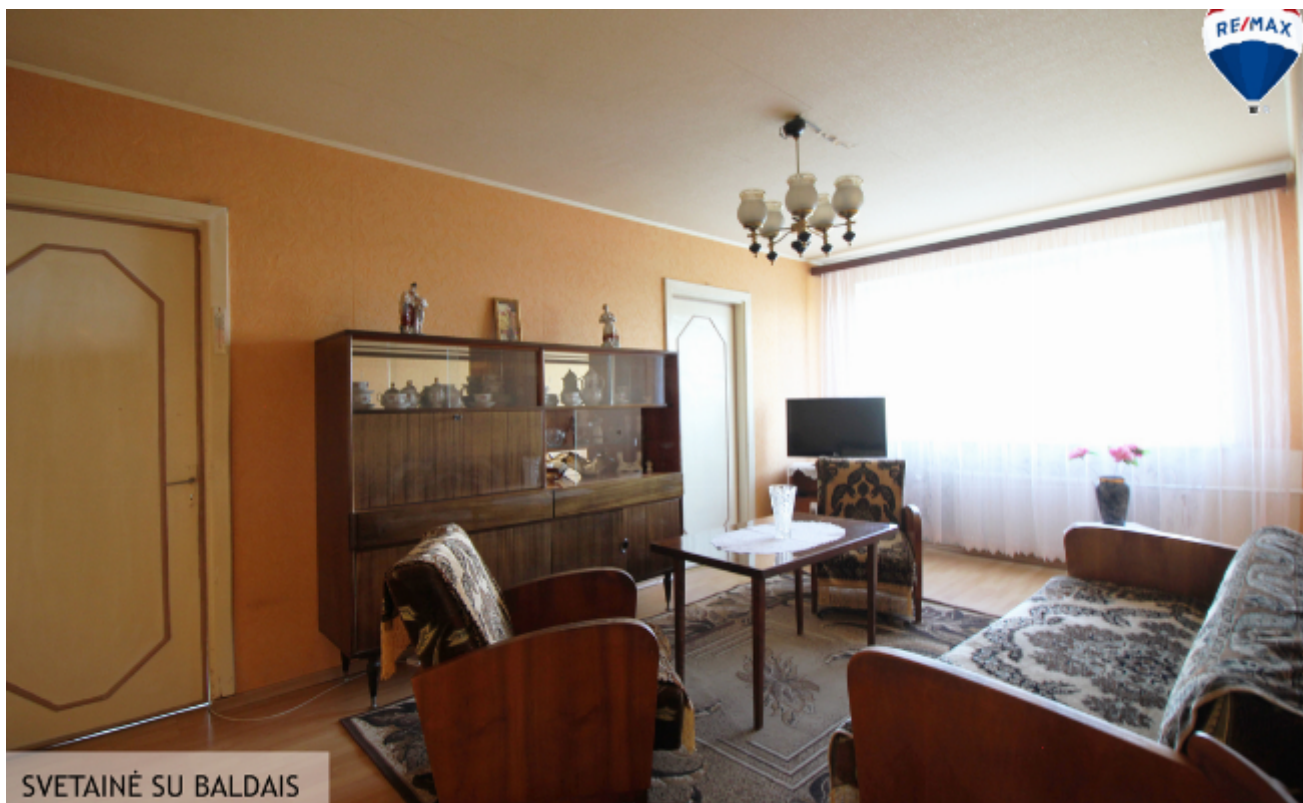
SVETAINĖ SU BALDAIS

🏠 Kambarių sk. 3 🏠 Statybos metai 1967 m. 📏 Plotas 47.84 m 2 📈 Aukštas 5/5