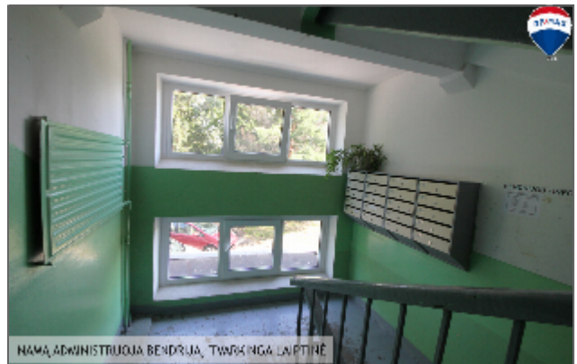
NAMŲ ADMINISTRUOJAMA BENDROJA, TŪRINKINGA LAIPTINĖ