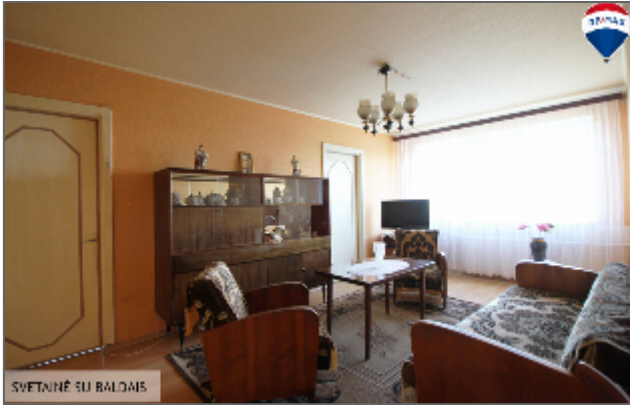
SVETAINĖ SU BALDOMIS