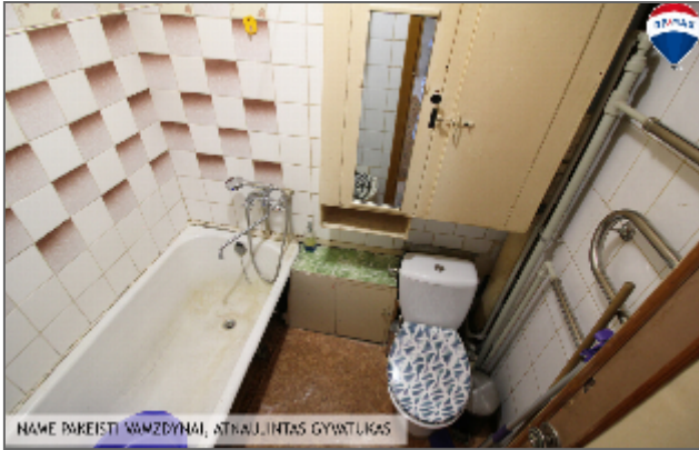
NAMŲ PAREIŠIŲ NAMŲ DYNAMIŠKAI STRAUKLIJANTIS GYVATUKAS