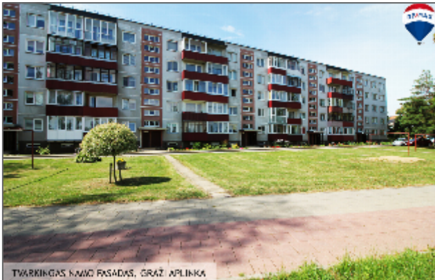
TŪRINKINGAS NAMŲ FASADAS, GRAŽI APLINKA