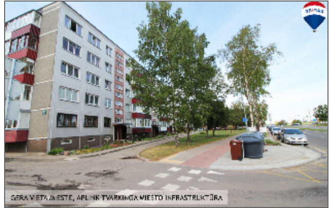
GERA VIETA, VESTĖ, APLINK TŪRINKINGA MIESTO INFRASTRUKTŪRA