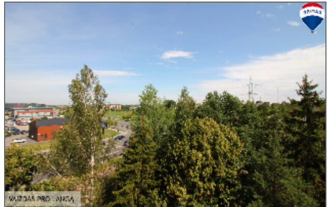
VAIZDAS PRO LANGĄ