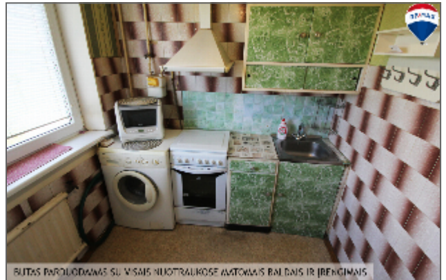
BUTAS ĮVYKDYMAS SU VISIŠ KAIŠTRAIKOSIŲ MAŠINŲ IR ĮRENGIMŲ