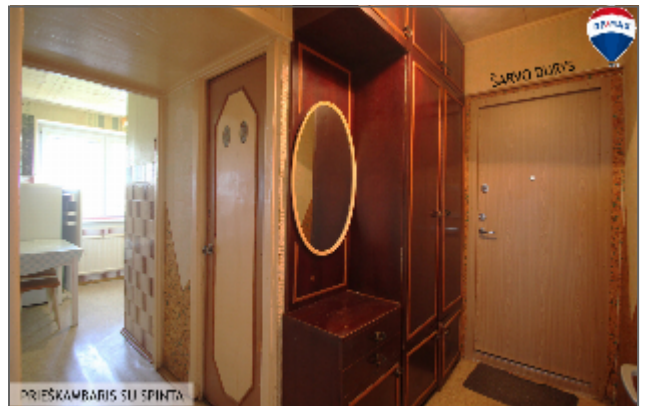
PRĮEŠKAMBIS SU SPINTA