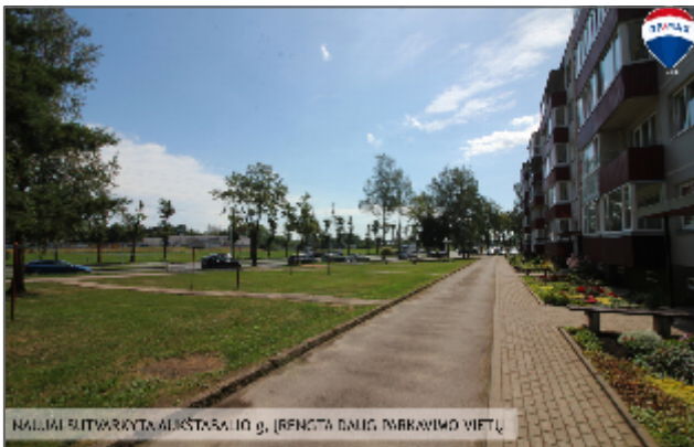
NALIAJAI SU TŪRINKINGA APLINKA, KITAŠKŲ JŪG, (REKONSTRUOTA DALIS PARKAVIMO VIETŲ)