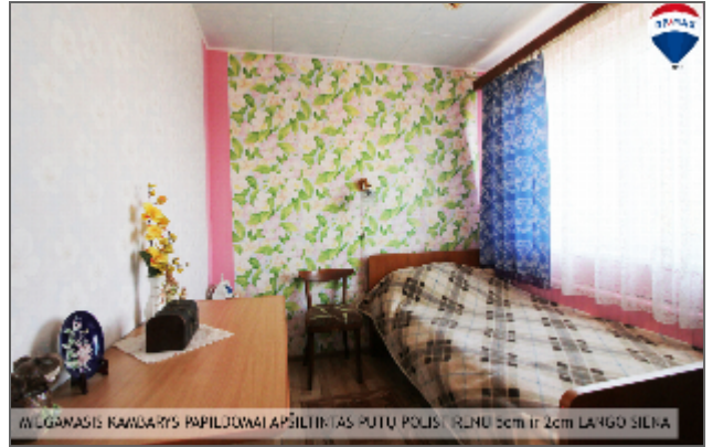
WILGAMAS KAMBARYS PAPILDOMAI APŠILDINTAS PUTŲ POLIS (RULNŲ 6cm ir 2cm LAIŠGO SILNA)