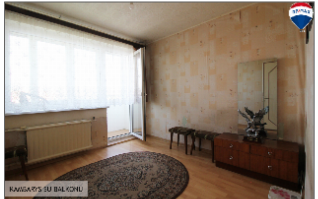
KAMBARYS SU BALKONU