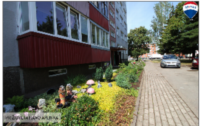
PRIZIŪRULIA NAMŲ APLINKA