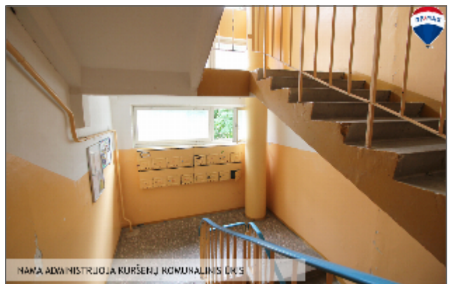
NAVA ADMINISTRUOJA KURŠENJ KOMUNALINIS DAIS