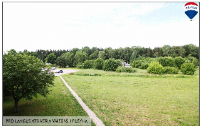
PRO LANGUS ATS VERIA VAIZDAS I PLŪŠYNĄ