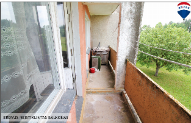
ERDVUS NEISTIKLINTAS BALKONAS