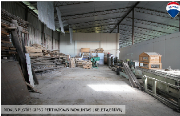
VIDAUS PLOTAS GIPSO PERTVARŲŲ PADALINTAS | KELETA ERDVIŲ