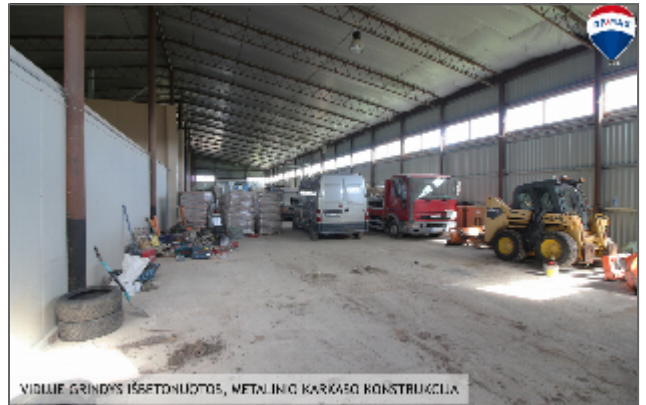
VIDURIF. GRINDYS IŠBETONUOTOS, METALINIO KARKASO KONSTRUKCIJA