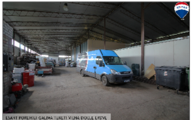
ESANT POREIKIUI GALIMA TURETI VIENĄ DIDELĘ ERDVĖ