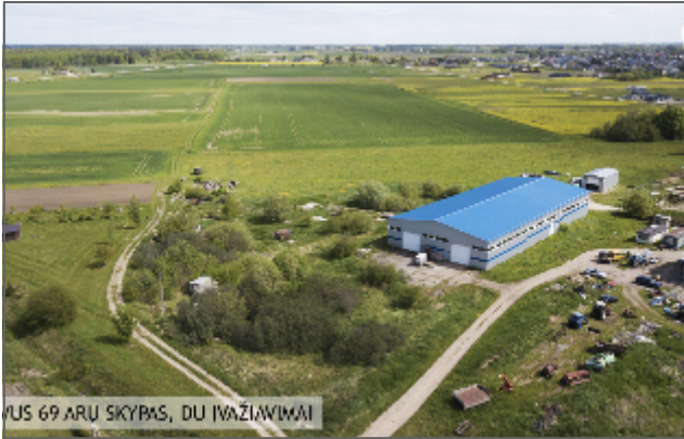
VIŠUS 69 ARŲ SKYPAŠAS, DU ĮVAŽIŲIMAI