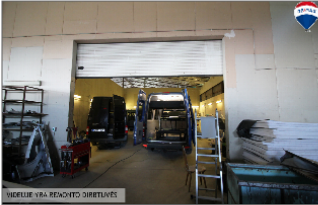
VIDEJUIE YRA REMONTO DIRBTUVĖS