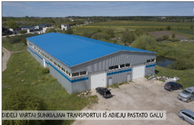
DIRBIAI VARTAI SUNKIAJAM TRANSPORTUI IŠ ABIEJŲ PASTATO GALŲ