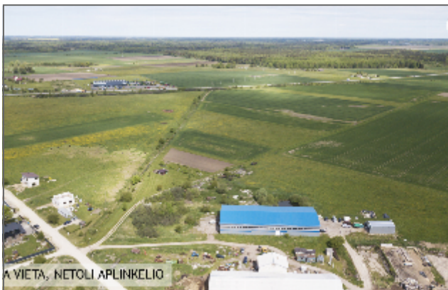
GERA VIETA, NETOLI APLINKELIO