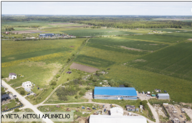
GERA VIETA, NETOLI APLINKELIO