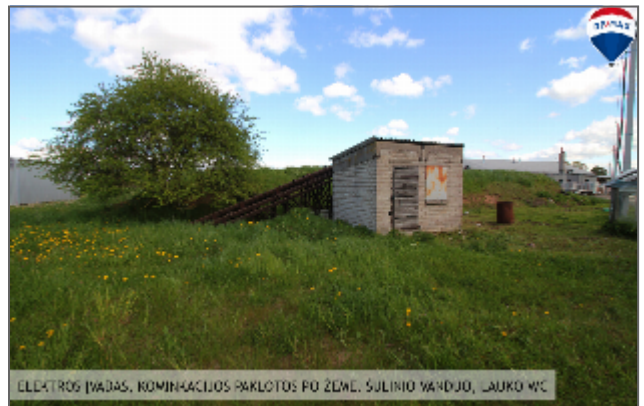
ELECTROS ĮVADAS, KOMINACIJOS PAKLOTOS PO ŽEMĖ. SŪLINIO VARDUOJ, LAUKO WC