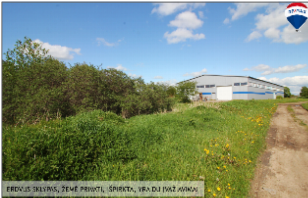
ERDVUS SKLYVAS, ŽEMĖ PRIEVIKI, ŠPIRKTA, YRA DU ĮVAŽ AVIJA