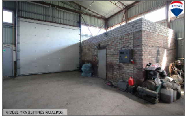
VIDEJUIE YRA BUITINĖS PATALPOS