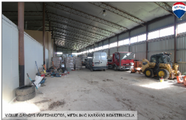
VIDURIF. GRINDYS IŠBETONUOTOS, METALINIO KARKASO KONSTRUKCIJA