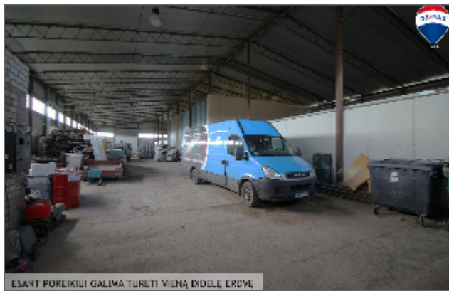
ESANT POREIKIUI GALIMA TURETI VIENĄ DIDELĘ ERDVĖ