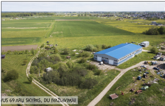
VIŠUS 69 ARŲ SKYPAŠAS, DU ĮVAŽIŲIMAI