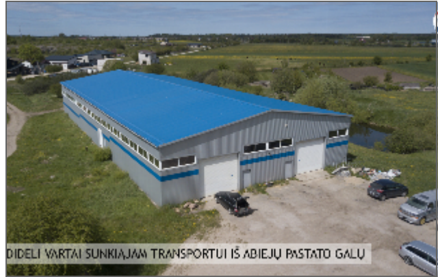
DIRŽELI VARTAI SUNKIAJAM TRANSPORTUI IŠ ABIEJŲ PASTATO GALŲ