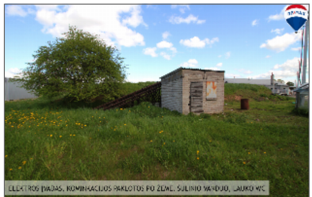
ELECTROS ĮVADAS, KOMINACIJOS PAKLOTOS PO ŽEMĖ, SŪLINIO VARDUOJ, LAUKO WC