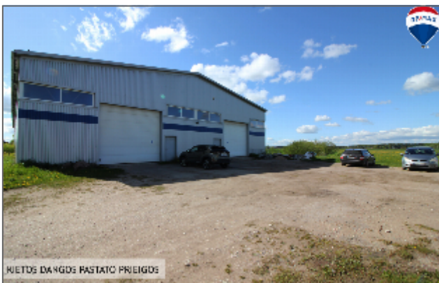
KUETOS DAUGS PASTATO PRIEIGS