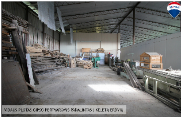
VIDAUS PLOTAS GIPSO PERTVARŲOMIS PADALINTAS | KELETA ERDVIŲ