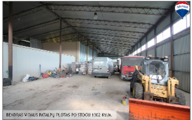
BENDRAS VIDULS PATALPŲ PLOTAS PO STOGU 1302 KV.M.