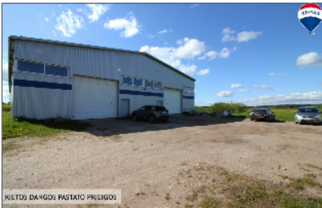
KUETOS DAUGS PASTATO PRIEIGDS