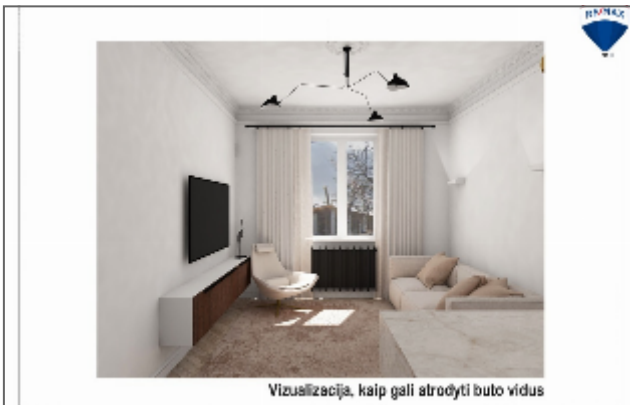
Vizualizacija, kaip gali atrodyti buto vidus