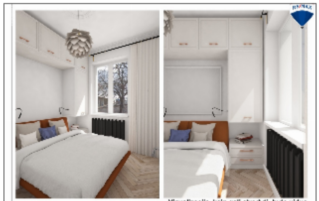
Vizualizacija, kaip gali atrodyti buto vidus