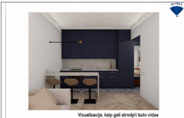
Vizualizacija, kaip gali atrodyti buto vidus