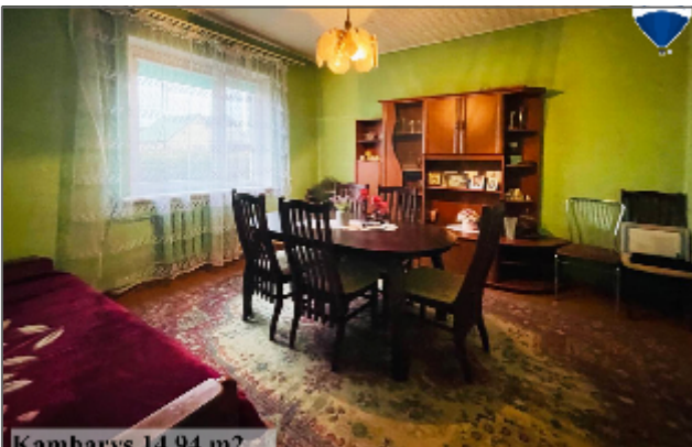
Kambaras 14.04 m 2