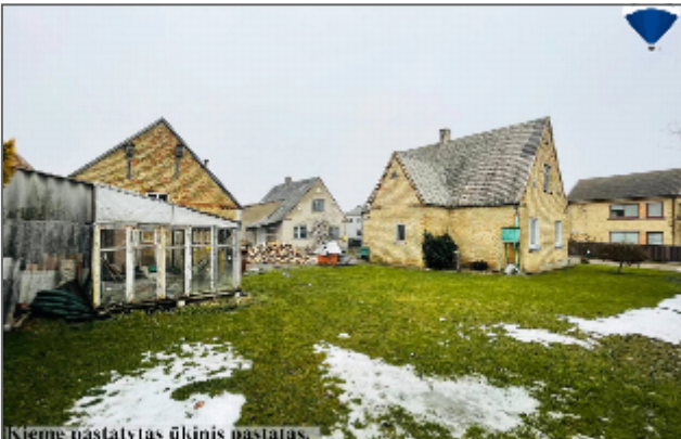
Kieme pastatytas ūkinis pastatas.