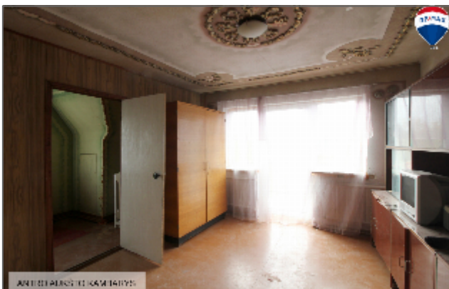
ANČIŲ PUSĖTĖ KAMBARIYS