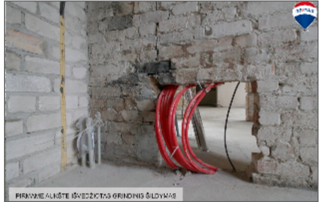
PIRMINE ALIŠTE IŠVEDŽIOTAS GRINDINIS ŠILDYMAS