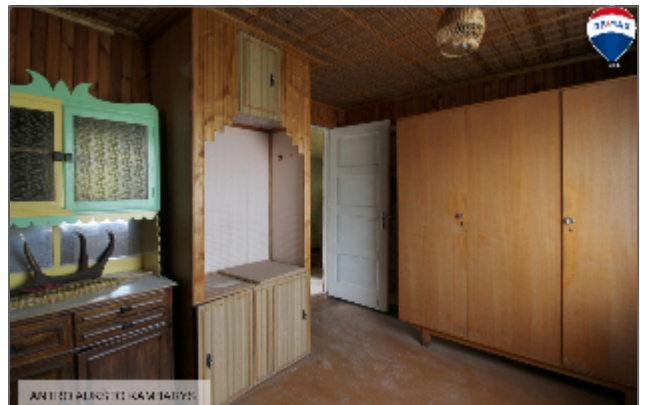
ANČIŲ PUSĖTĖ KAMBARIYS