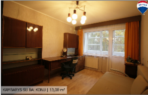
KAMBARYS SU BAL. KONU | 13,00 m 2