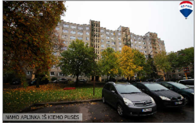
NAMO APLINKA IŠ KIEMO PUSĖS