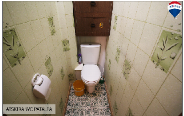
ATSKIRA WC PATALPA