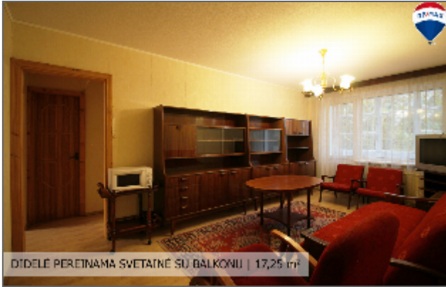
DIDELĖ POREINAMA SVETAINĖ SU BALKONU | 17,25 m 2