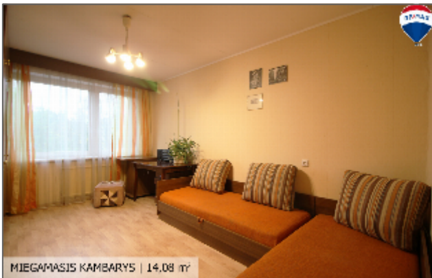
MIEGAMASIS KAMBARYS | 14,08 m 2