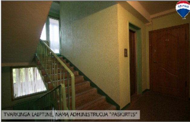
TVARKINGA LAIPTINĖ, NAMŲ ADMINISTRUOJA "PASKIRTIS"