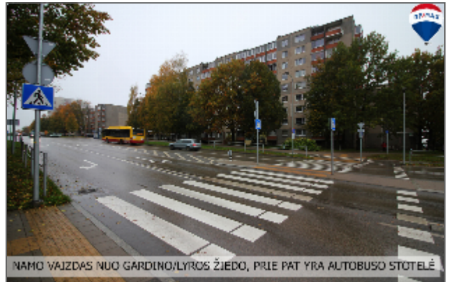
NAMO VAJZDAS NUO GARDINO/LYROS ŽIEDO, PRIE PAT YRA AUTOBUSO STOTELĖ