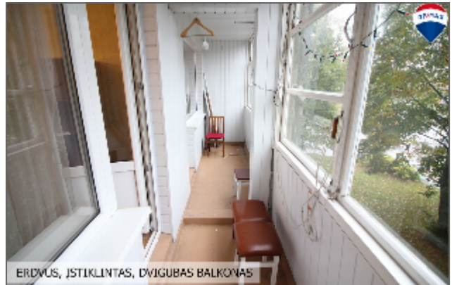
ERDVUS, ISTIKLINTAS, DVIGUBAS BALKONAS