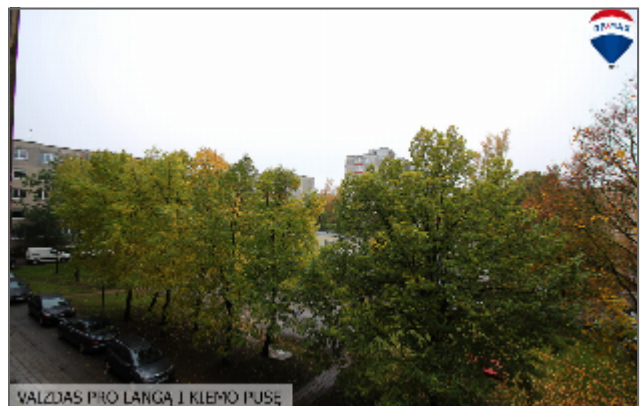
VALZDAS PIRU LANGA | KIEMO PUSE