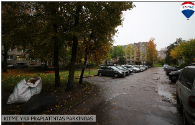
KIEME YRA PRAPLATINTAS PARKINGAS