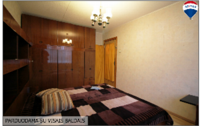
PARDUODAMA SU VISAIS BALDAIS