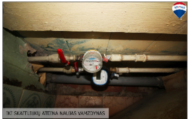
IKI SKAITLIUKŲ ATETA NAUJAS VAMZDYNAS