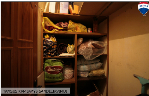
TAMSUS KAMBARYS SANDĖLIAVIMUI