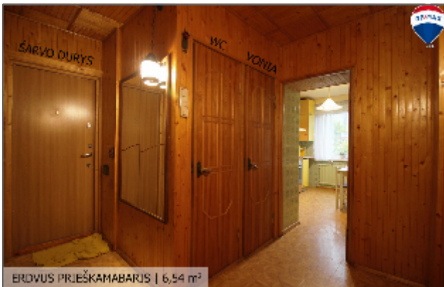
ERDVUS PRIEŠKAMABARIS | 6,54 m 2