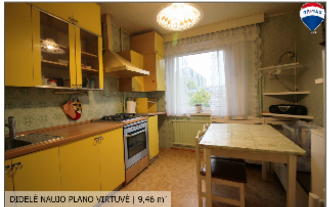
DIDELĖ NAUJO PLANO VIRTUVĖ | 9,46 m 2