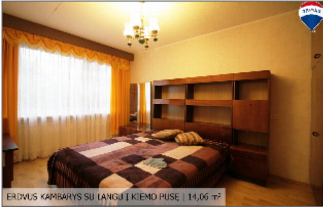
ERDVUS KAMBARYS SU LANGU | KIEMO PUSE | 14,06 m 2