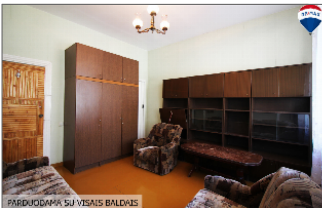
PARDUODAMA SU VISAIŠ BALDAIS