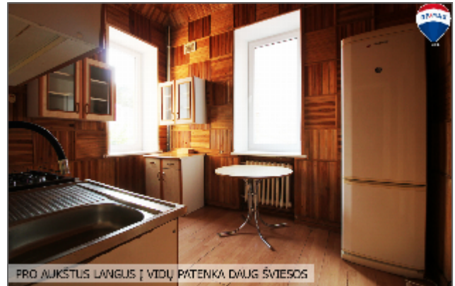
PRO AUKŠTUS LANGUS Į VIDŲ PATEIKA DAUG ŠVIESOS