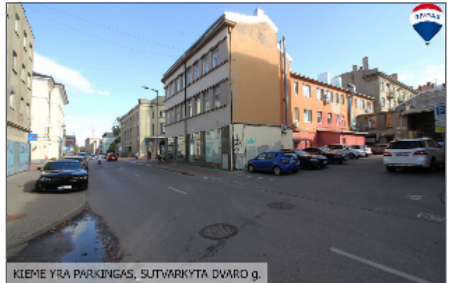
KIEME YRA PARKINGAS, SUTVARKYTA DVARO q.