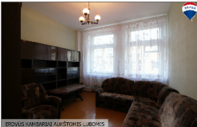
ERDVUS KAMBARIŲ AUKŠTOMIS LUBOMIS