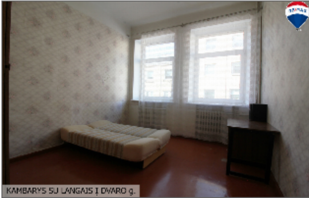
KAMBARYS SU LANGAIS Į DVARO g.