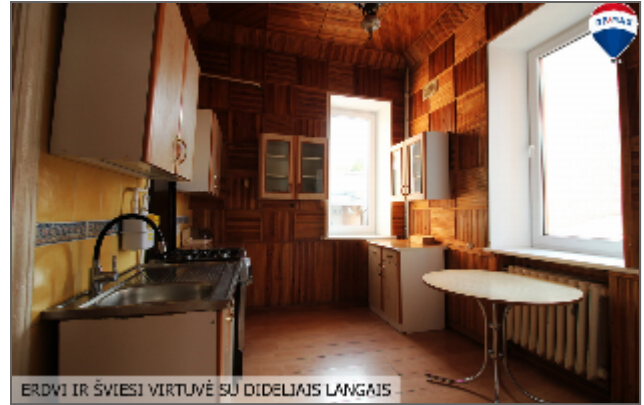
ERDVI IR ŠVIESI VIRTUVĖ SU DIDELIAIS LANGAIS