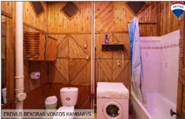
ERDVUS BENDRAS VONIOS KAMBARYS