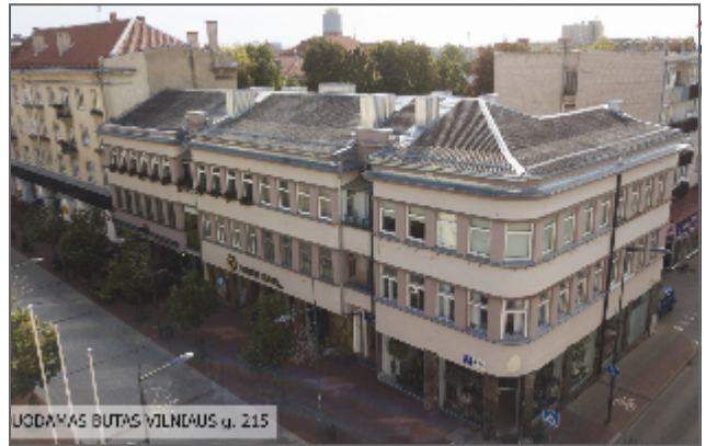
UODAMAS BUTAS VILNAUS q. 215