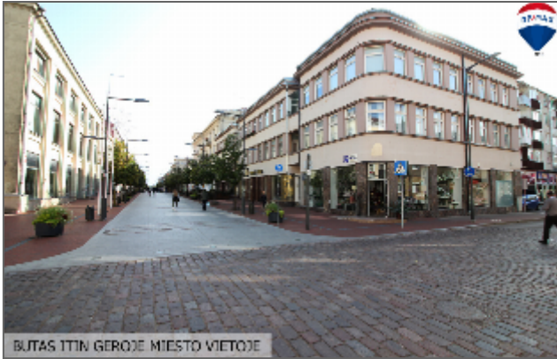
BUTAS ITIN GEROJE MIESTO VIETOJE