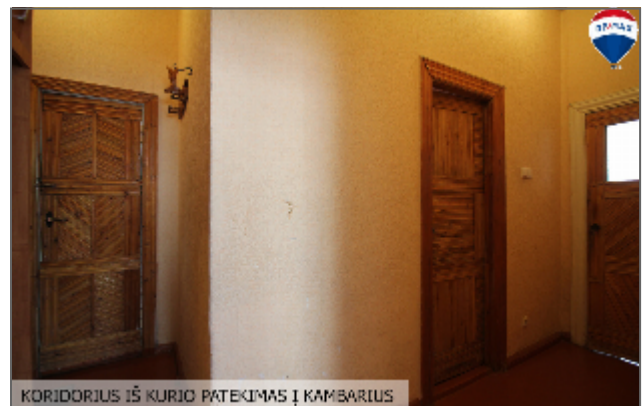
KORIDORIUS IŠ KURIO PATEIKIMAS Į KAMBARIUS