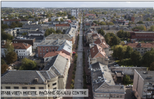
STABI VIETA MIESTE, PAČIAME ŠIAULIŲ CENTRE