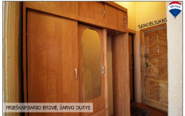
PRIEŠKAMBARIO ERDVĖ, ŠARVO DURYS