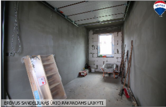
ERDVUS SANDĒLĪKAS ŪKIO RAKANDAMS LAJKYTI