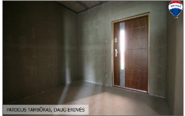
PATOGUS TAMBŪRAS, DAUG ERDVĒS