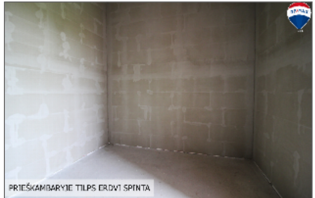
PRIEŠKAMBARYJE TILPS DRŪVI SPINTA