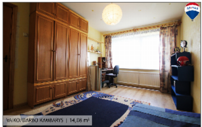
VAIKO/DARBO KAMBARYS | 14,08 m 2