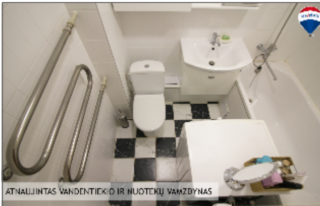
ATNAUJINTAS VANDENTIEKIO IR NUOTEKŲ VAMZDYNAS