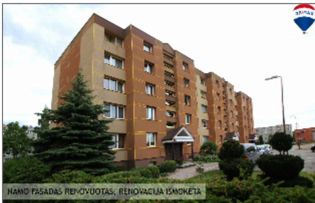
NAMO FASADAS RENOVUOTAS, RENOVACIJA IŠMOKETA