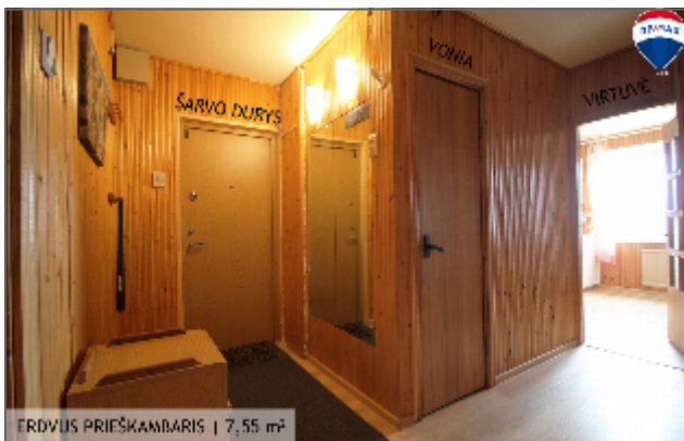
ERDVIS PRIEŠKAMBARIS | 7,55 m 2