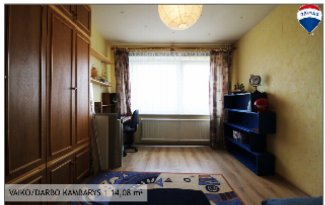
VAIKO/DARBO KAMBARYS | 14,08 m 2