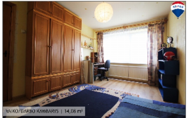
VAIKO/DARBO KAMBARYS | 14,08 m 2