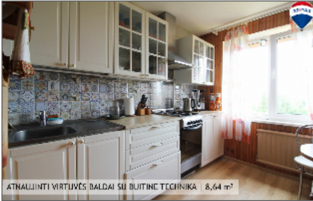
ATNAUJINTI VIRTUVĖS DALIAI SU BUITINE TECHNIKA | 8,64 m 2