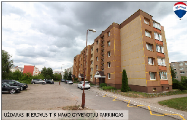
UŽDARAS IR ERDVUS TIK NAMŲ GYVENTOJŲ PARKINGAS