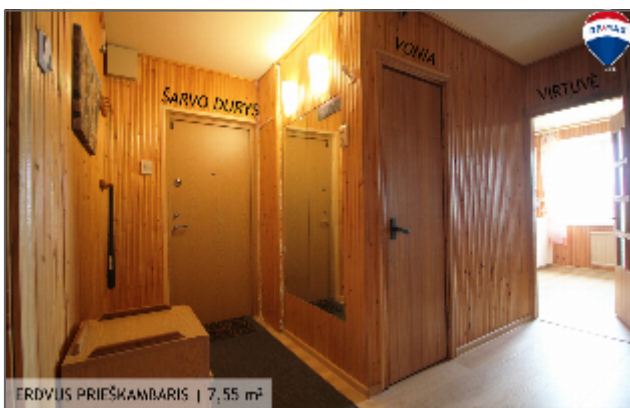
ERDVIS PRIEŠKAMBARIS | 7,55 m 2