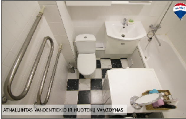
ATNAUJINTAS VANDENTIEKIO IR NUOTEKŲ VAMZDYNAS