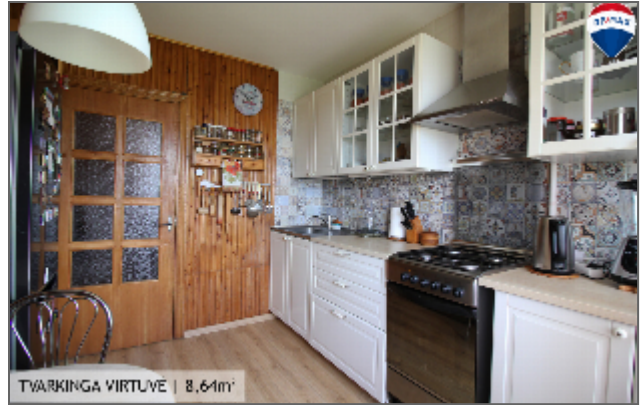
TVARKINGA VIRTUVĖ | 8,64m 2