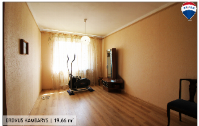
ERDVUS KAMBARYS | 19,66 m 2