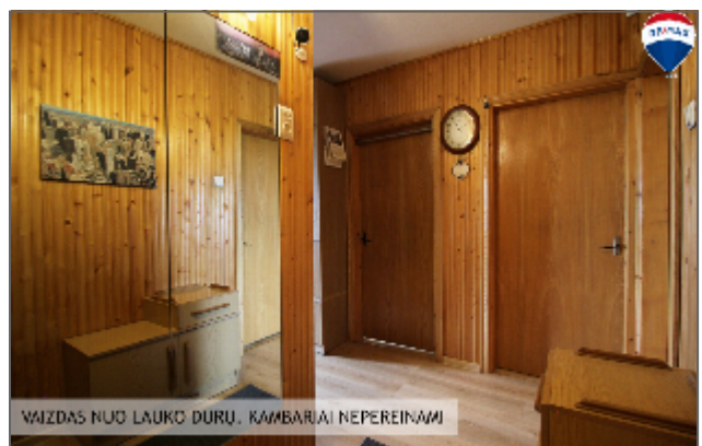
VAIZDAS NUO LAUKO DURŲ. KAMBARIAI NEPEREINAMI