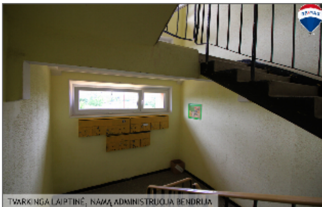
TVARKINGA LAIPTINĖ, NAMŲ ADMINISTRUOJAMA BENDRIJA