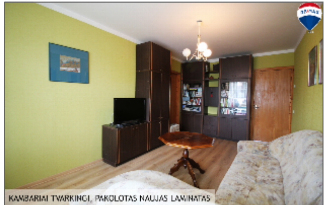
KAMBARIAI TVARKINGI, PAKOLOTAS NAUJAS LAMINATAS