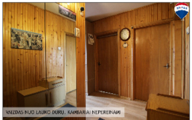
VAIZDAS NUO LAUKO DURŲ. KAMBARIAI NEPEREINAMI