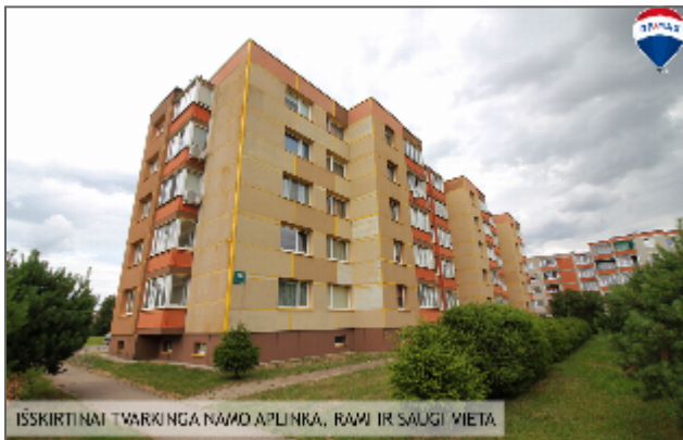
IŠSKIRTINAI TVARKINGA NAMO APLINKA, RAMI IR SAUGI VIETA