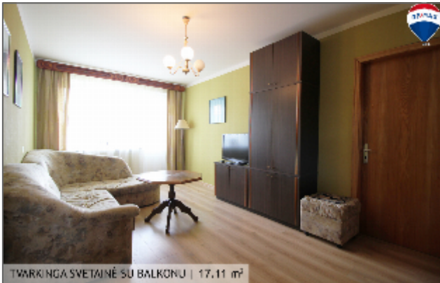
TVARKINGA SVETAINĖ SU BALKONU | 17,11 m 2