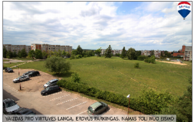
VAIZDAS PRO VIRTUVĖS LANGĄ, ERDVUS PARKINGAS, NAMAS TOLI NUO EISMO