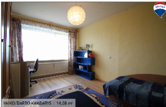
VAIKO/DARBO KAMBARYS | 14,08 m 2