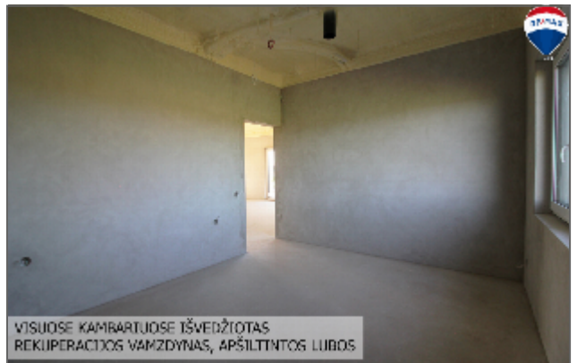
VISUOSE KAMBARIUOSE IŠVEDŽIOTAS REKUPERACIJOS VAMZDYNAS, APSĪLTINTOS LUBOS