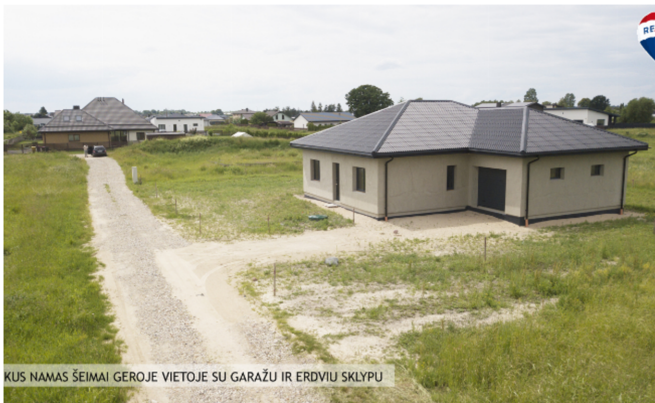
KUS NAMAS ŠEIMAI GEROJE VIETOJE SU GARAŽU IR ERDVIU SKLYPU