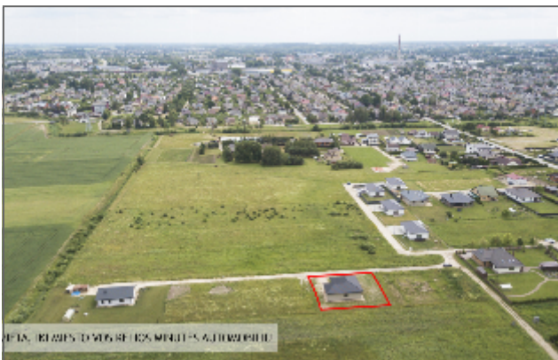
ŠIS NAMAS SĖDMI CERKĖJE VIETUJE SU CARAŽŲ IR ERDVŲ SKLYPU