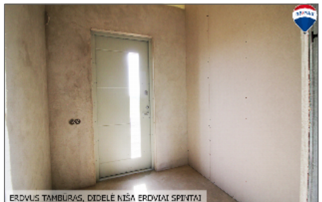
ERDVUS TAMBŪRAS, DIDELĖ NIŠA ERDVAI SPINTAI