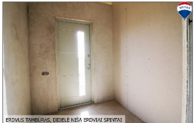
ERDVUS TAMBŪRAS, DIDELĖ NIŠA ERDVAI SPINTAI