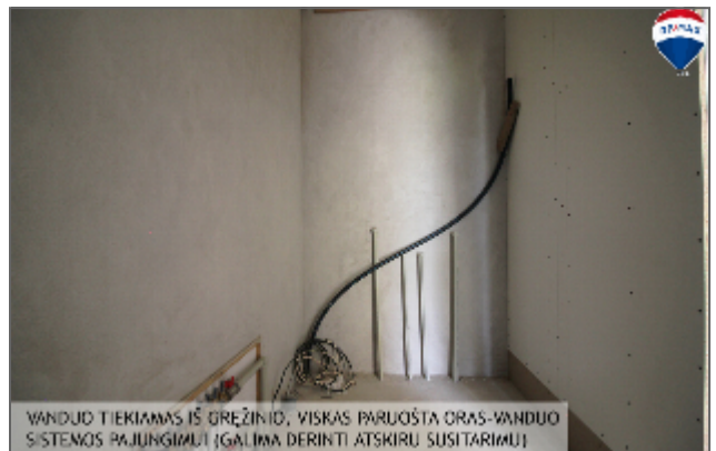
VANDUO TIEKIAMAS IŠ GREŽINIO, VISKAS PARUŠTA ORAS-VANDUO SISTEMOS RAJUNGIMUI (GALIMA DERINTI ATSKIRU SUSITARIMU)