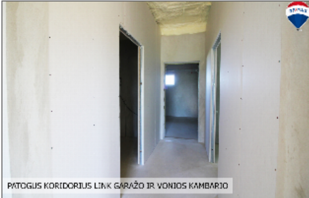
PATOGUS KORIDORIUS LINK GARAŽO IR VONIOS KAMBARIO