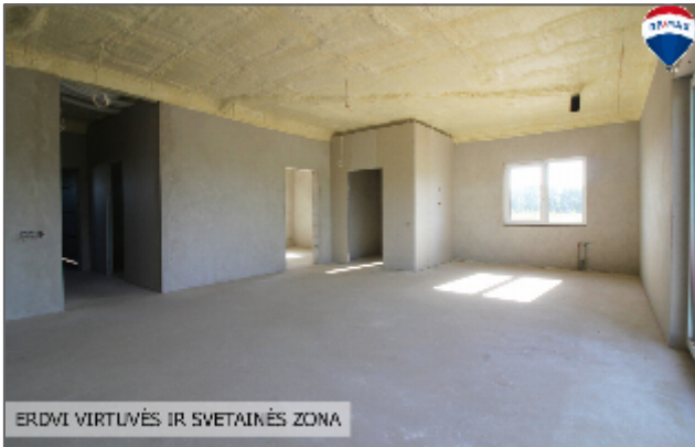
ERDVĪ VIRTUVĒS IR SVETAINĒS ZONA