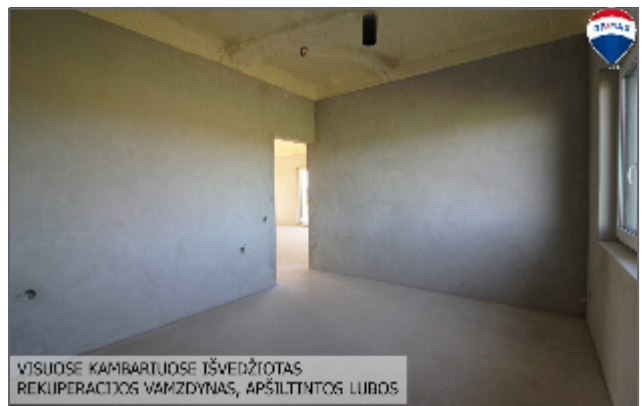
VISUOSE KAMBARIUOSE IŠVEDŽIOTAS REKUPERACIJOS VAMZDYNAS, APSĪLTINTOS LUBOS