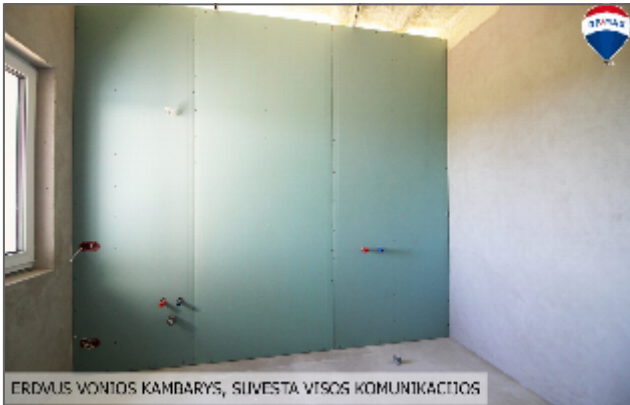
ERDVUS VONIOS KAMBARYS, SUVESTA VISOS KOMUNIKACIJOS