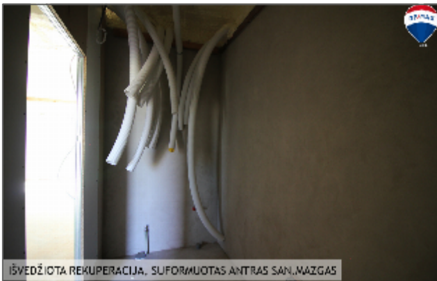
IŠVEDŽIOTA REKUPERACIJA, SUFORMUOTAS ANTRAS SAN.MAZGAS