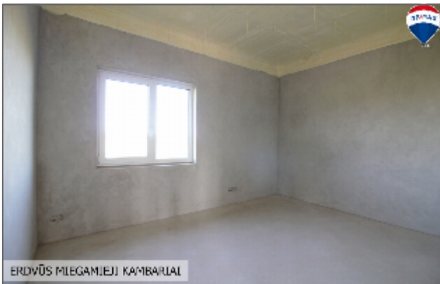
ERDVŪS MĪLEGAMIEJŲ KAMBARIAI