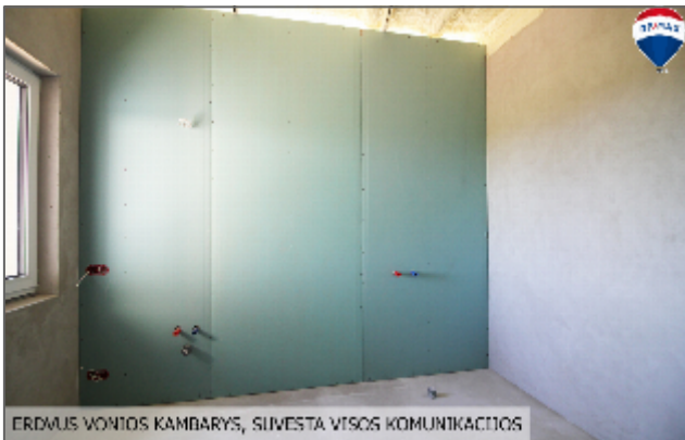
ERDVUS VONIOS KAMBARYS, SUVESTA VISOS KOMUNIKACIJOS