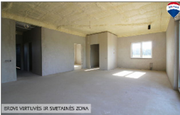
ERDVĪ VIRTUVĒS IR SVETAINĒS ZONA