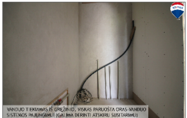
VANDUO TIEKIAMAS IŠ GREŽINIO, VISKAS PARUŠTA ORAS-VANDUO SISTEMOS PAJUNGIMUI (GALIMA DERINTI ATSKIRU SUSITARIMU)