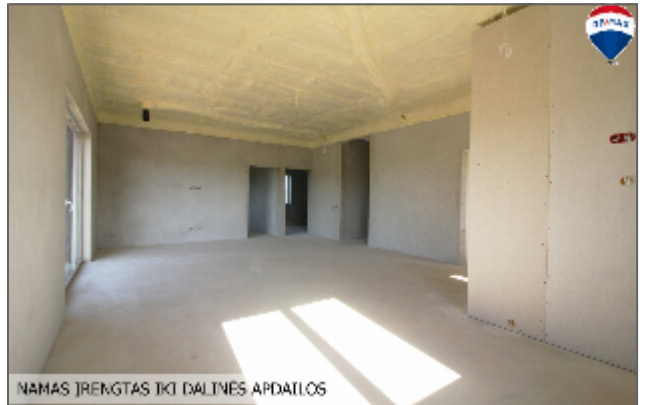
NAMAS ĮRENGTAS IKI DALINĖS APDAILOS