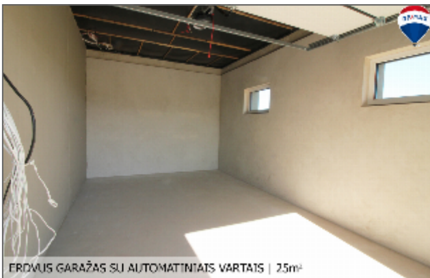
ERDMUIS GARAŽAS SU AUTOMATINIAMS VARTAIS | 25m²