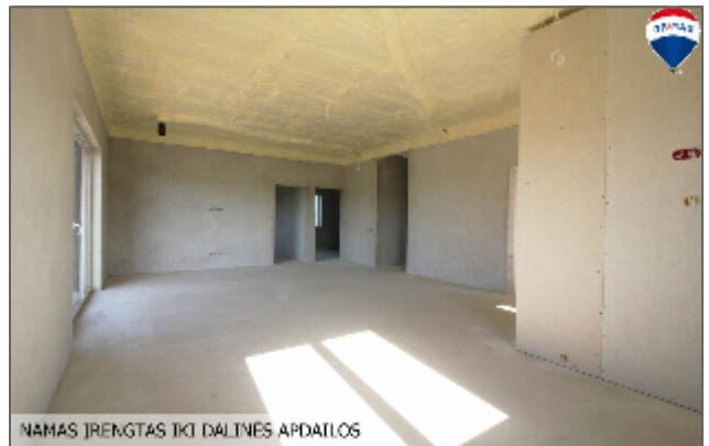
NAMAS ĮRENGTAS IKI DALINĖS APDAILOS