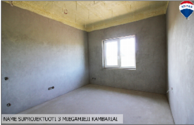
NAMĖ SUPROJEKTUOTI 3 MĖGAMIEJI KAMBARIAI