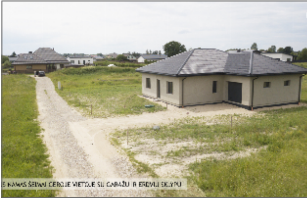
ŠIS NAMAS SĖDMI CERKĖJE VIETUJE SU CARAŽŲ IR ERDVŲ SKLYPU