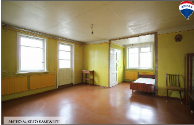
ANTRAS ALŪSTY KAMBARAVYS