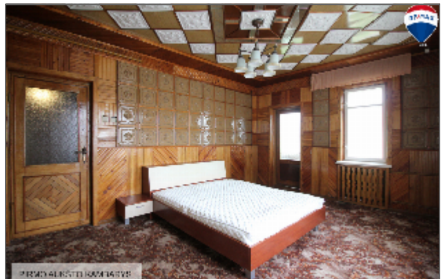
PRIMO AGENSI HOME 14755