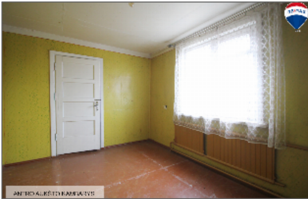
ANTRAS ALIŠTYS KAMBARAVYS