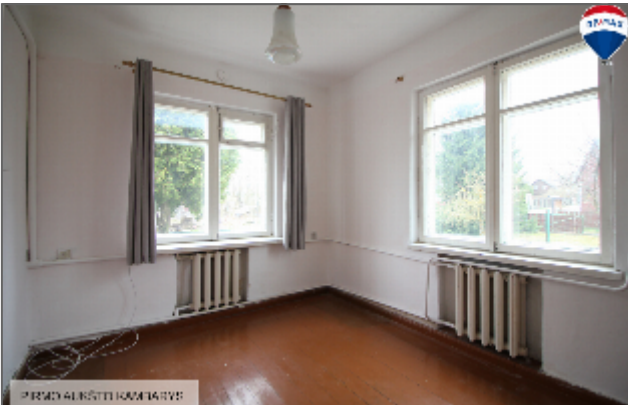
PRIMO AGENSI HOME 14755