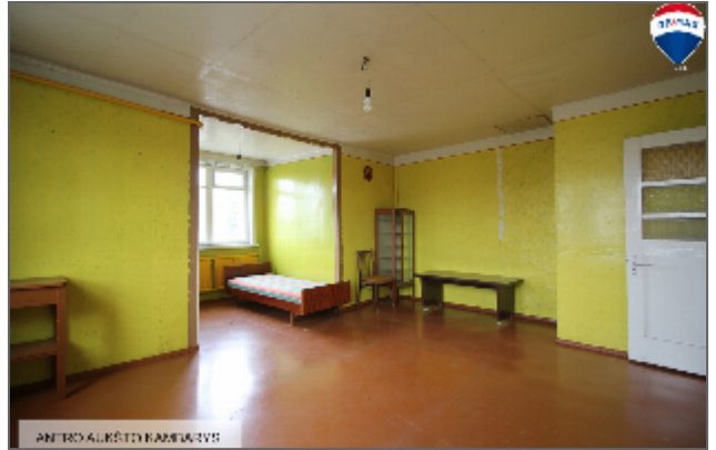
ANTRAS ALŪSTY KAMBARAVYS