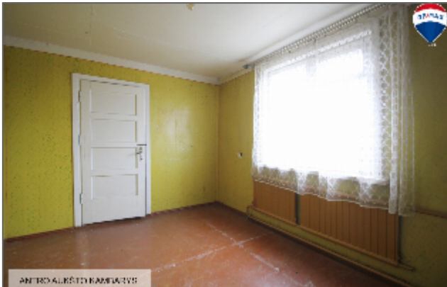
ANTRAS ALŪSTY KAMBARAVYS