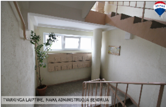
TVARKINGA LAIPTINĖ, NAMŲ ADMINISTRUOJAMA BENDRIJA