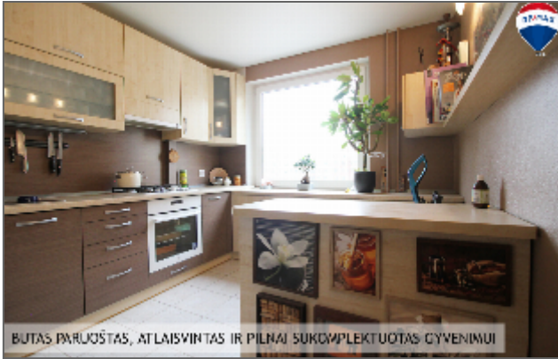
BUTAS PARUŠTAS, ATLAISVINTAS IR PILNAI SUKOMPLEKTUOTAS GYVENIMUI