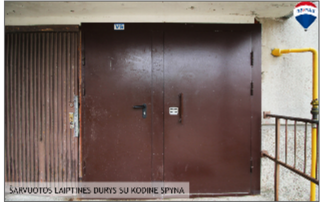
ŠARVUOTOS LAIPTINĖS DURYS SU KODINE SPYNA