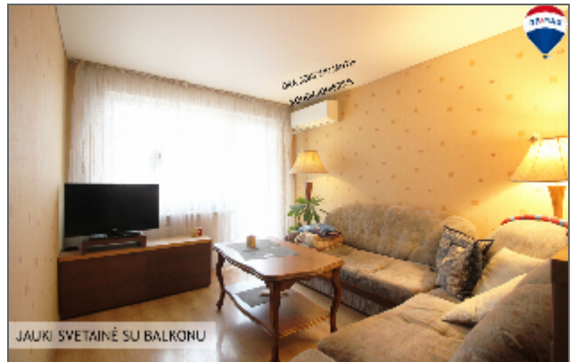
JAUKI SVETAINĖ SU BALKONU