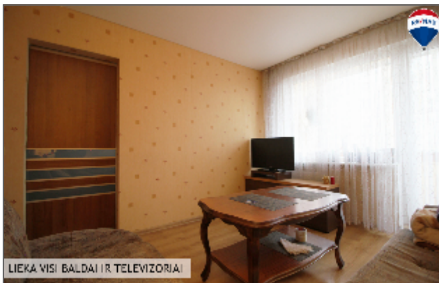
LIEKA VISI BALDAI IR TELEVIZORIAI