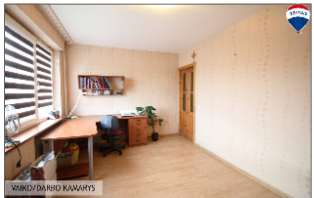
VAIKO DARBO KAMARYS