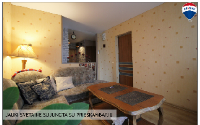
JAUKI SVETAINĖ SUJUNGTA SU PRIEŠKAMBIU