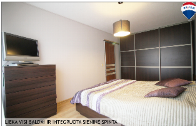
LIEKA VISI BALDAI IR INTEGRUOTA SIENINĖ SPINTA