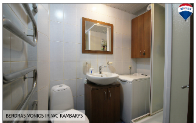
BENDRAS VONIOS IR WC KAMBARYS