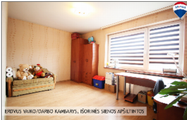
ERDVUS VAIKO/DARBO KAMBARYS, IŠORINĖS SIENOS APŠILTINTOS