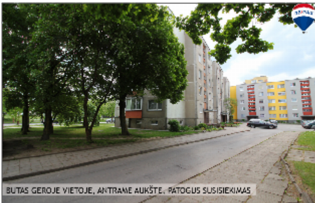
BUTAS GEROJE VIETOJE, ANTRAME AUKŠTE. PATOGUS SUSISIEKIMAS