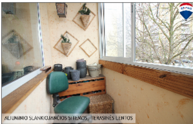
ALUMINIO SLANKIOJANČIOS SI TENOS, TERASINĖS LENTOS