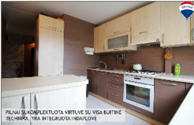
PILNAI SUKOMPLEKTUOTA VIRTUVĖ SU VISA BUITINE TECHNIKA, YRA INTEGRUOTA ĮNDAPLOVĖ