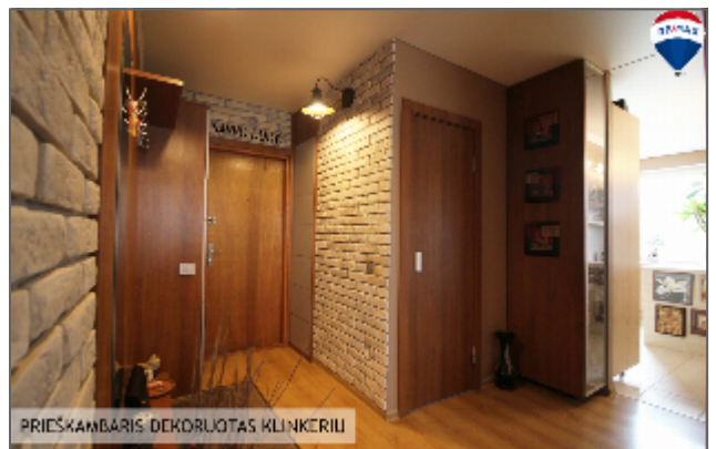
PIEŠKAMBARIS DEKORUOTAS KLINKERIŲ