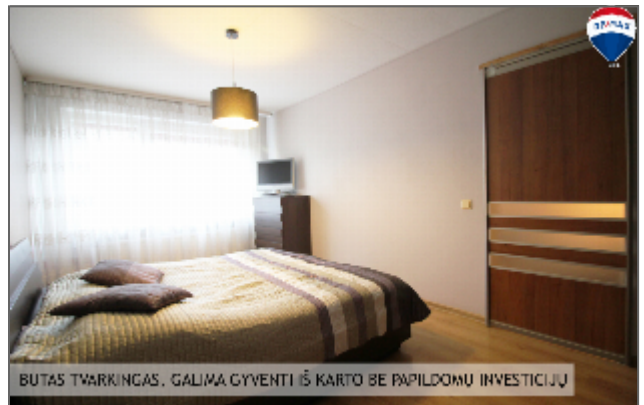
BUTAS TVARKINGAS, GALIMA GYVENTI IŠ KARTO BE PAPILDOMŲ INVESTICIJŲ