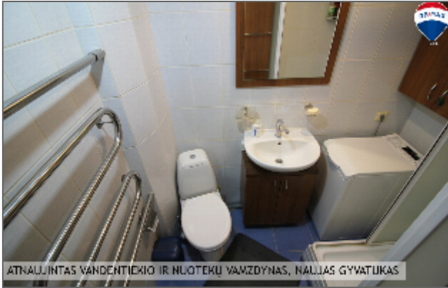
ATKALIJINTAS VANDENTIEKIO IR NUOTEKŲ VAMZDYNAS, NAUJAS GYVATUKAS