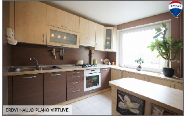
ERDVI NAUJO PLANO VIRTUVĖ