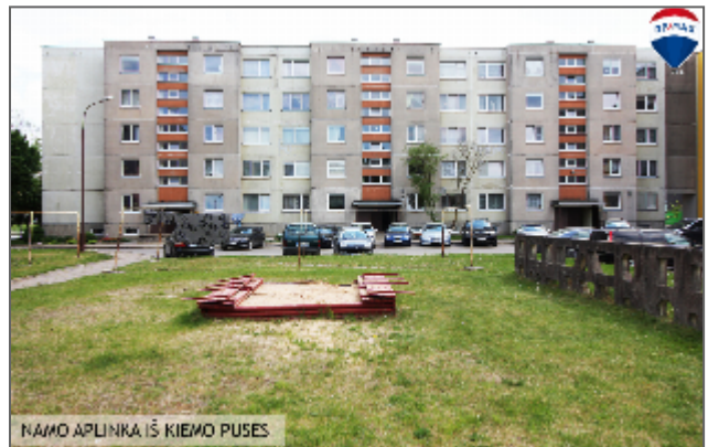
NAMO APLINKA IŠ KIEMO PUSĖS