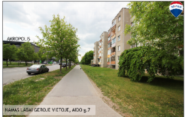
NAMAS LABAI GEROJE VIETOJE, AIDO g.7