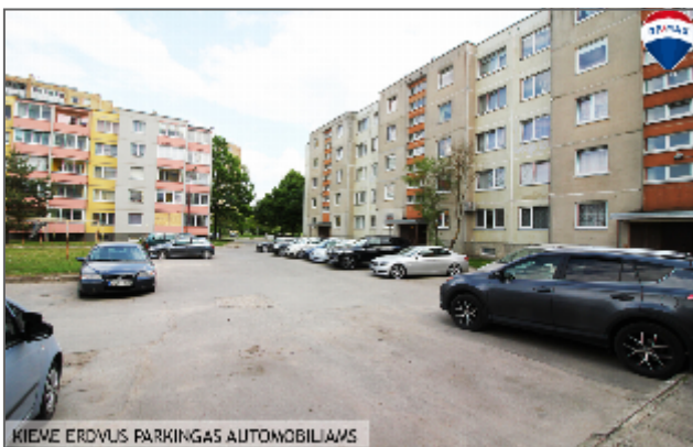
KIEME ERDVUS PARKINGAS AUTOMOBILIAMS