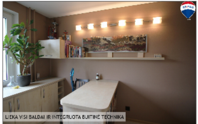
LIEKA VISI BALDAI IR INTEGRUOTA BUITINĖ TECHNIKA