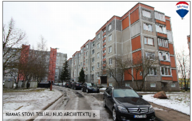
NAMAS STVI TOLIAU NUO ARCHITEKTŲ g.