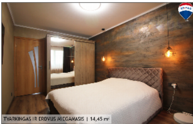
TVARKINGAS IR ERDVUS MIEGAMASIS | 14,45 m 2