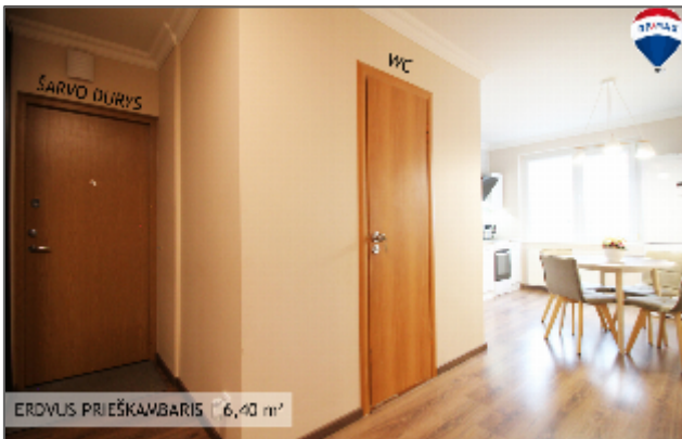
ERDVUS PRIEŠKAMBARIS | 6,40 m 2