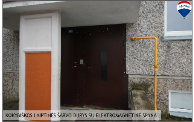
KOKYBIŠKOS LAIPTINĖS ŠARVO DURYS SU ELEKTROMAGNETINE SPYNA