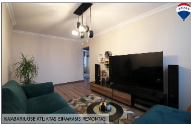
KAMBARIUOSE ATLIKTAS EINAMASIS REMONTAS