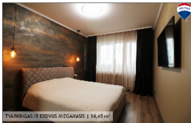
TVARKINGAS IR ERDVUS MIEGAMASIS | 14,45 m 2