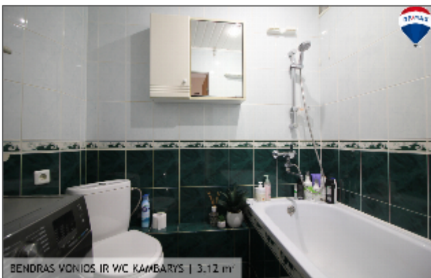
BENDRAS VONIOS IR WC KAMBARYS | 3,12 m 2