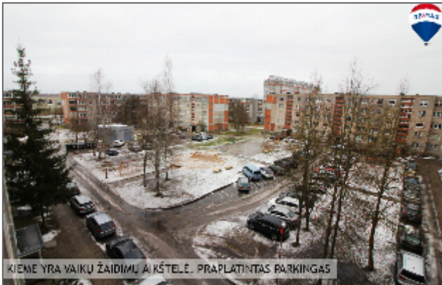
KIEME YRA VAIKŲ ŽAIDIMŲ AIKŠTELĖ, PRAPLATINTAS PARKINGAS