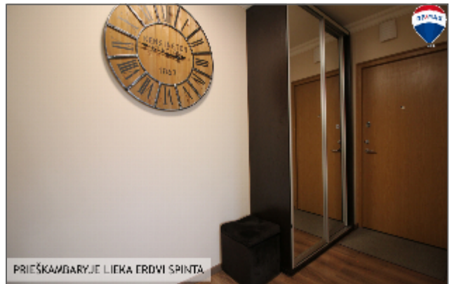
PRIEŠKAMBARIJE LIEKA ERDVI SPINTA