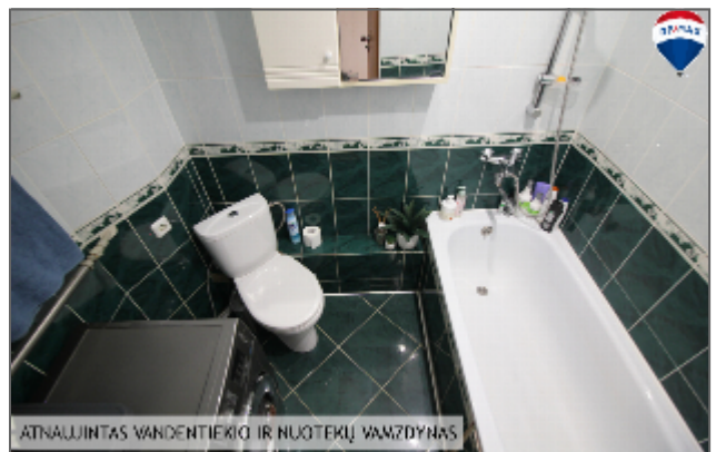
ATNAUJINTAS VANDENTIEKIO IR NUOTEKŲ VAMZDYNAS