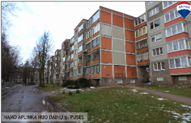
NAMO APLINKA NUO DAINŲ g. PUŠĖS