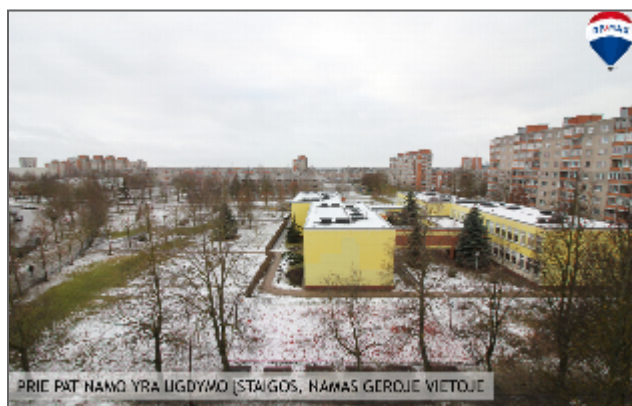
PRIE PAT NAMO YRA LIGDYMO (STAIGOS, NAMAS GERDIE VIETOJE)