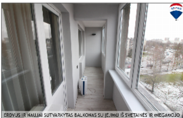
ERDVUS IR NAUJAI SUTVARKYTAS BALKONAS SU JEJINKU IŠ SVETAINES IR MIEGANOJO