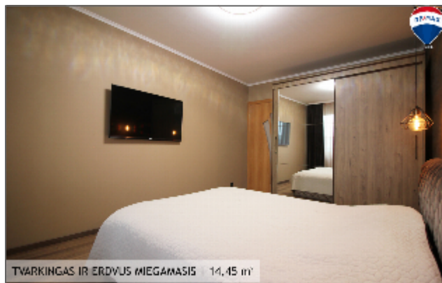
TVARKINGAS IR ERDVUS MIEGAMASIS | 14,45 m 2