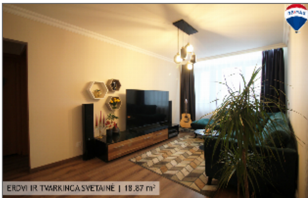
ERDVI IR TVARKINGA SVETAINE | 18,87 m 2