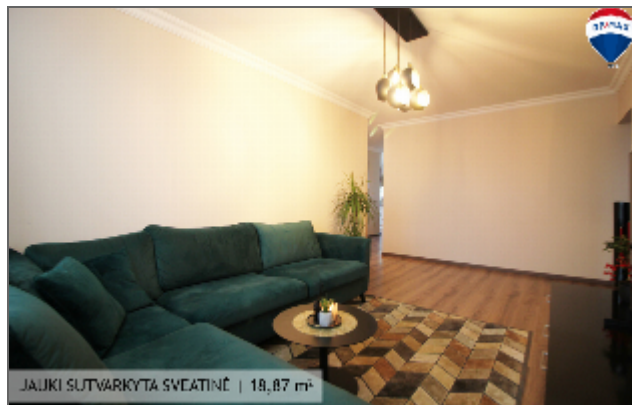
JAUKI SUTVARKYTA SVETAINE | 18,87 m 2