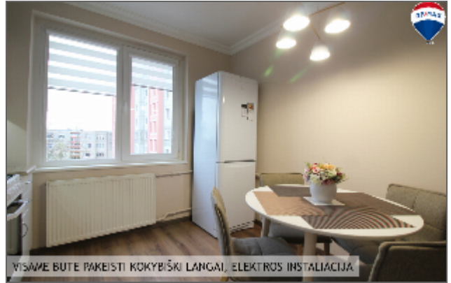
VISAME BUTE PAKEISTI KOKYBIŠKI LANGAI, ELEKTROS INSTALIACIJA