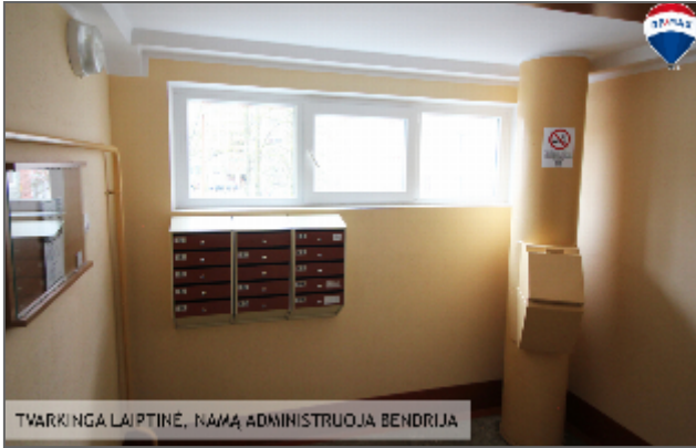
TVARKINGA LAIPTINĖ, NAMŲ ADMINISTRUOJA BENDRIJA