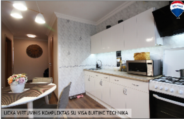
LIEKA VIRTUVINIS KOMPLEKTAS SU VISA BUITINE TECHNIKA