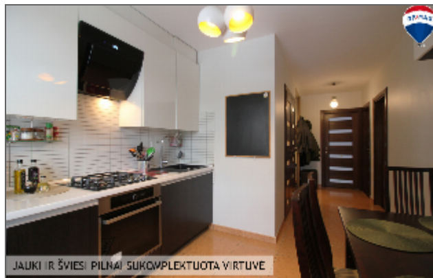
JAUKI IR ŠVIESI PILNAI SUKOMPLEKTUOTA VIRTUVE