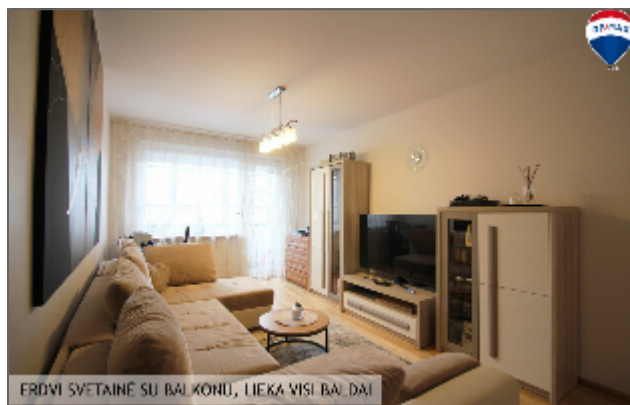
ERDVI SVETAINĖ SU BALKONU, LIEKA VISI BAI DAI