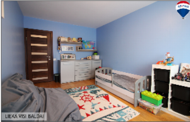
LIEKA VISI BALDAI