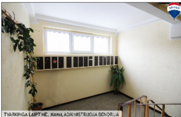
TVARKINGA LAIPTINE. NAMĄ ADMINISTRUOJA BENDRIJA