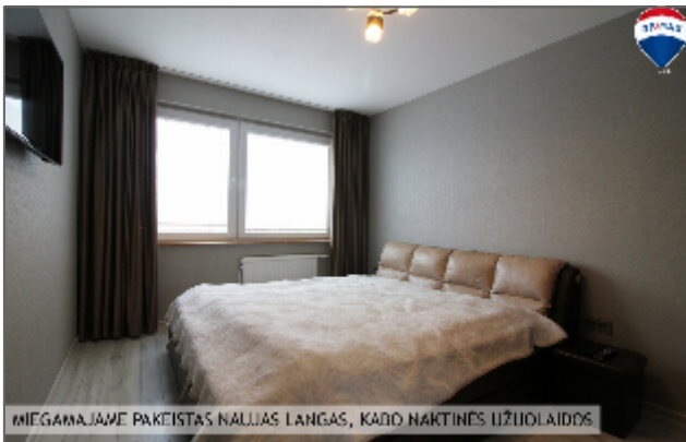
MIEGAMAJAME PAKĖISTAS NAULIJS LANGAS, KAIPD NAKTINĖS LIŽIUOLAIDOS