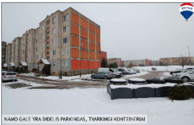
NAMO GALĖ YRA DIDELIS PARKINGAS, TVARKINGI KONTEINERIAI