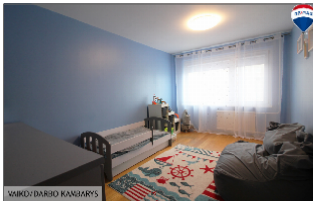
VAIKO/ DARBO KAMBARYS