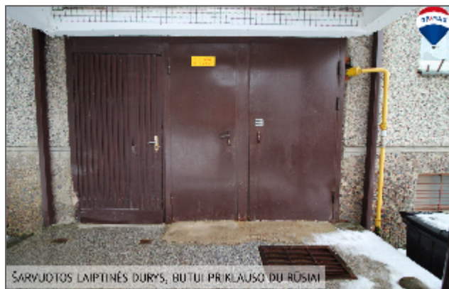
ŠARVUOTOS LAIPTINĖS DURYS, BUTUI PRIKLAUSO DU ROSIAI