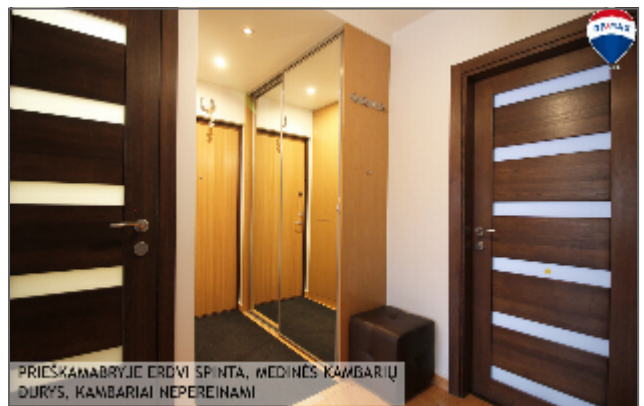
PRIEKAMABRYJIE ERDVI SPINTA, MEDINĖS KAMBARIŲ DURYS, KAMBARIAI NEPEREINAMI