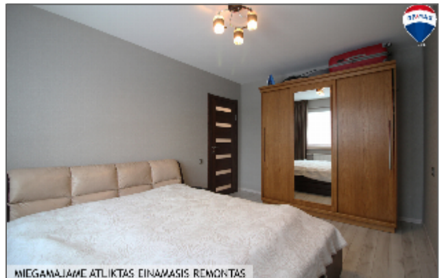
MIEGAMAJAME ATLIKTA EINAMASIS REMONTAS