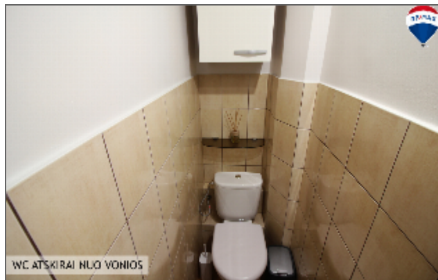
WC ATSKIRAI NULO VONIOS