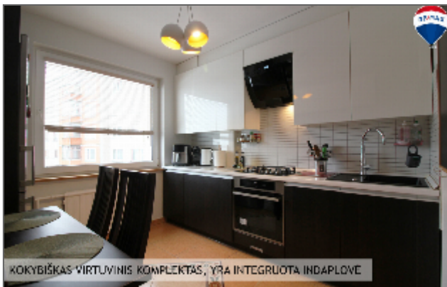
KOKYBIŠKAS VIRTUVINIS KOMPLEKTAS, YRA INTEGRUOTA INDAPLOVE