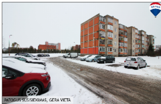
PATOGUS SUSISIEKIMAS, GERA VIETA