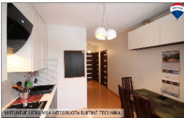
VIRTUVĖJE LIEKA VISA INTEGRUOTA BUITINĖ TECHNIKA