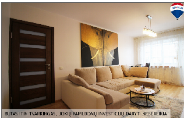
BUTAS ITIN TVARKINGAS, JOKIŲ PAPILDOMŲ INVESTICIJŲ DARYTI NEBEREIKIA