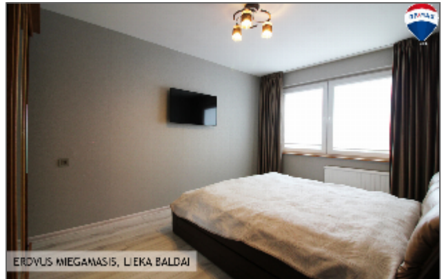
ERDVUS MIEGAMASIS, LIEKA BALDAI