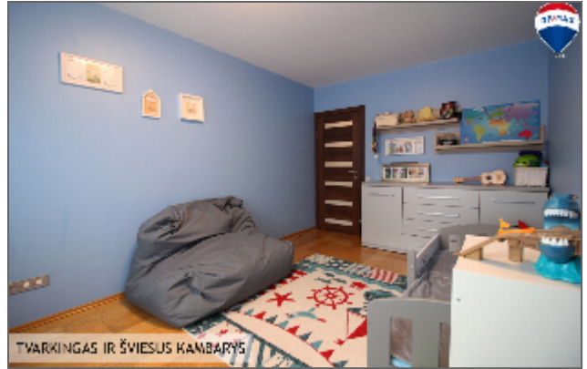
TVARKINGAS IR ŠVIESUS KAMBARYS