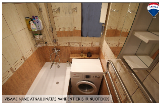
VISAME NAME ATNAUJINATAS VANDENTIEKIS IR NUOTEKOS