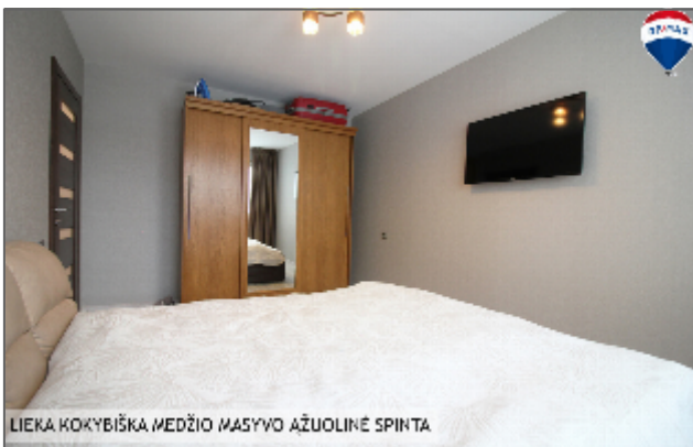
LIEKA KOKYBIŠKA MEDŽIO MASYVO AŽUOLINĖ SPINTA