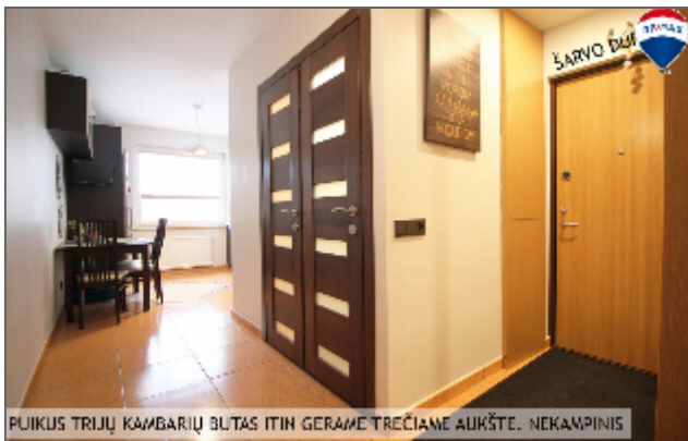
PUIKUS TRIJŲ KAMBARIŲ BUTAS ITIN GERAME TREČIAME AUKŠTE. NEKAMPINIS