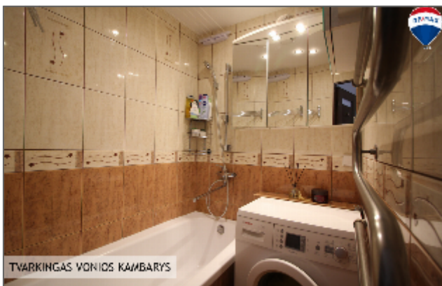
TVARKINGAS VONIOS KAMBARYS