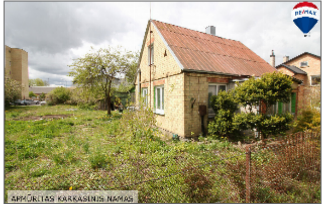
4PMŪRTAS KARKASINIS NAMAS