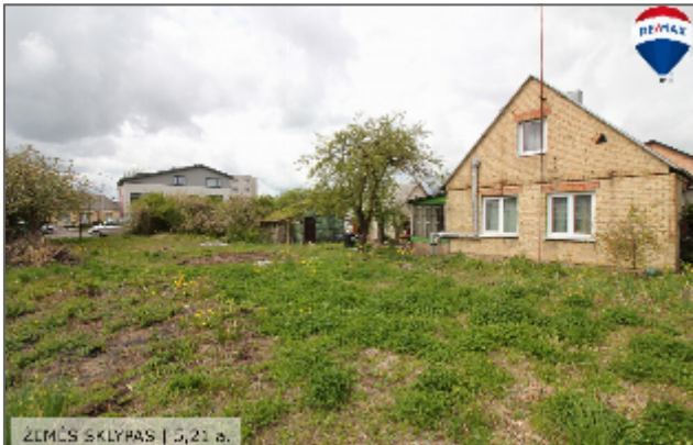
ŽEMŪS SKLYPAS | 5,21 a.