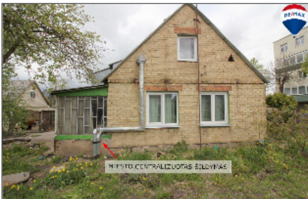
MIFRITO CENTRALIZUOTAS ŠILUMAS