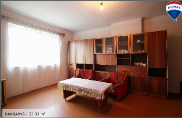
KABINĀRYS | 23.33 m 2