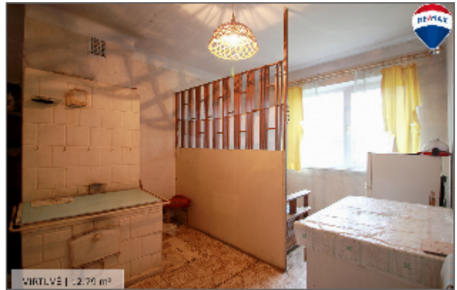
VIKŅĻVĒ | 2.79 m 2