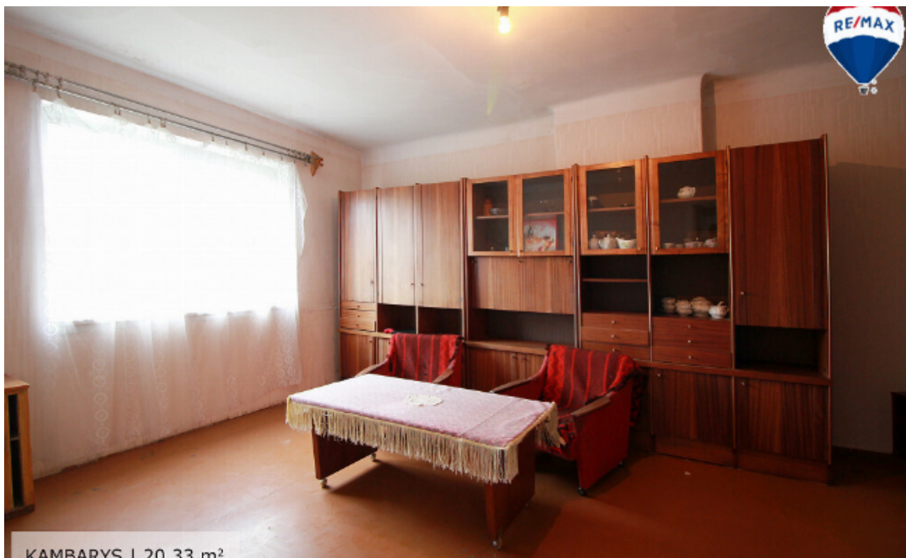
KAMBARYS | 20.33 m 2