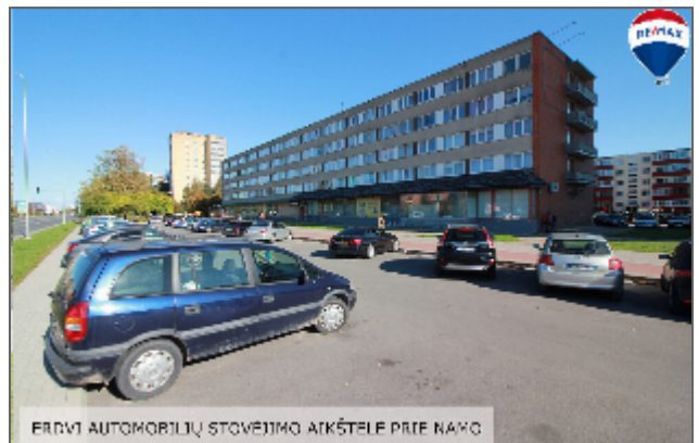
ERDVY AUTOMOBILIŲ STOVĖJIMO AIKŠTELĖ PRIE KAMO