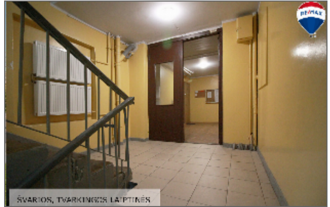
ŠVARTOS, TVARKINGOS LAIPTINĖS