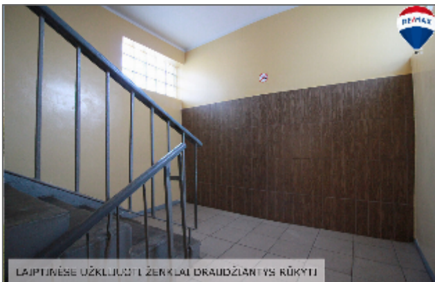
LAIPTINĖSE UŽKLIUSŲI ŽERKLAI DRAUDŽIANTYS RŪKYTI