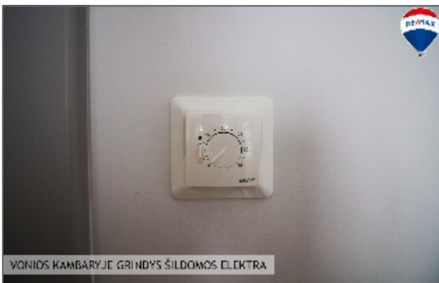
VONIOS KAMBARYJE GRINDYS ŠILDOMOS ELEKTRA