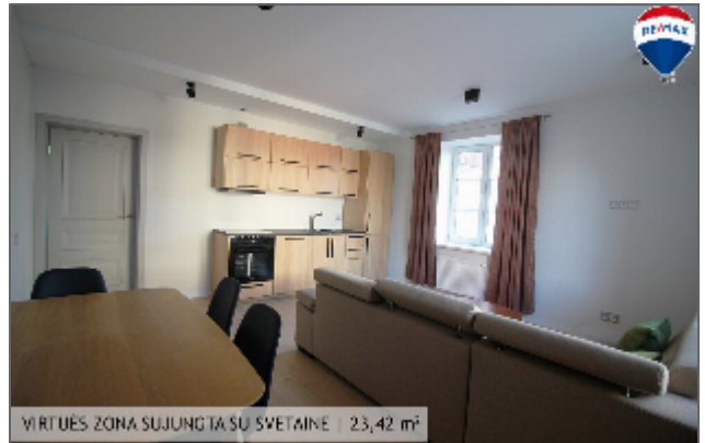
VIRTUVĖS ZONA SUJUNGTA SU SVETAINĖ | 23,42 m 2