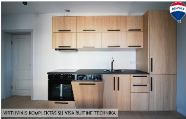
VIRTUVINIS KOMPLEKTAS SU VISĄ BUITINE TECHNIKA