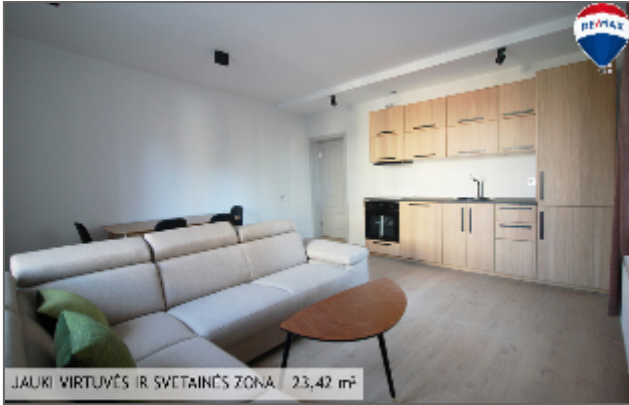
JAUKI VIRTUVĖS IR SVETAINĖS ZONA | 23,42 m 2