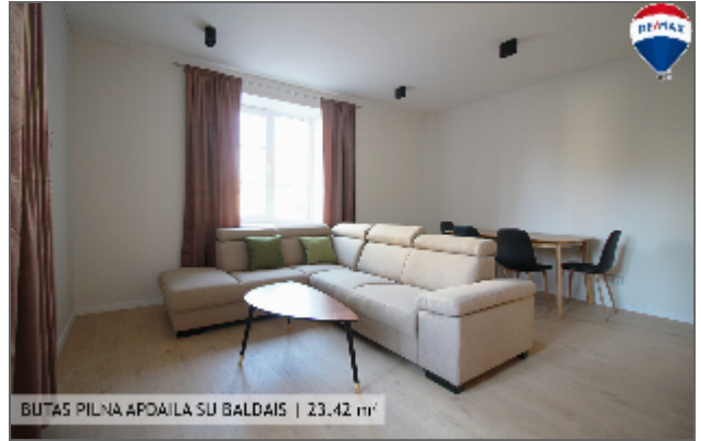
BUTAS PILNA APDAILA SU BALDAIS | 23,42 m 2