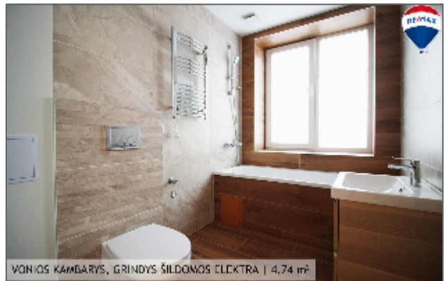
VONIOS KAMBARYS, GRINDYS ŠILDOMOS ELEKTRA | 4,74 m 2