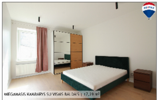
MIEGAMASIS KAMBARYS SU VISAI BALDAIS | 17,29 m 2