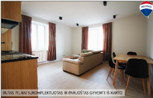
BUTAS PILNAI SUKOMPLEKTUOTAS IR PARUŠTAS GYVENTI IŠ KARTO