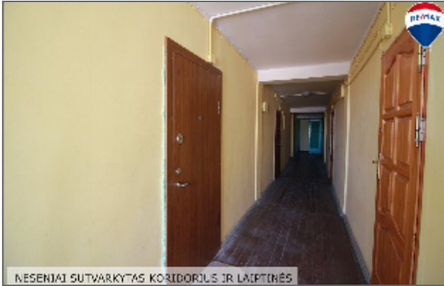
NESENIAI SUTVARKYTAS KORIDORJUS IR LAIPTINĖS