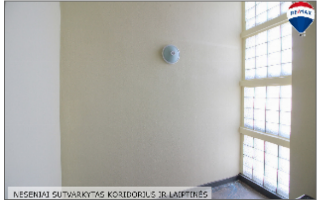
NESENIAI SUTVARKYTAS KORIDORJUS IR LAIPTINĖS