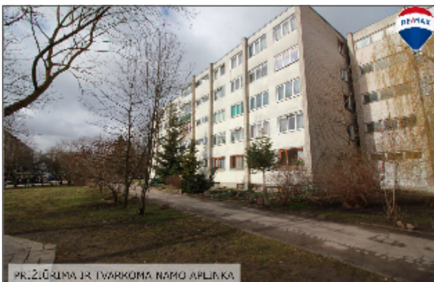
PRŽIŪRIMA IR TVARKOMA NAMO APLINKA