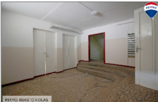
PIRMO AUKŠTIO TILAS