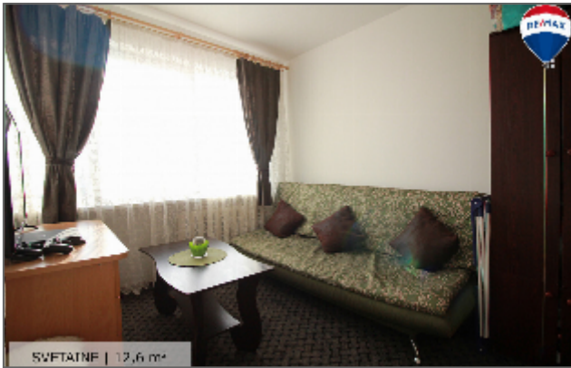
SVETAINE | 12,6 m 2