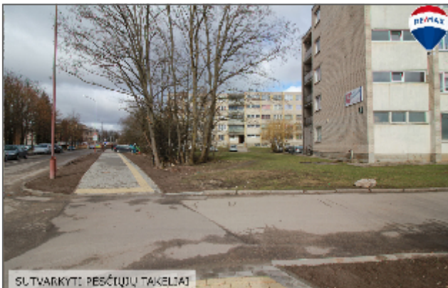
SUTVARKYTI PĖSČIŲ TAKELIAI