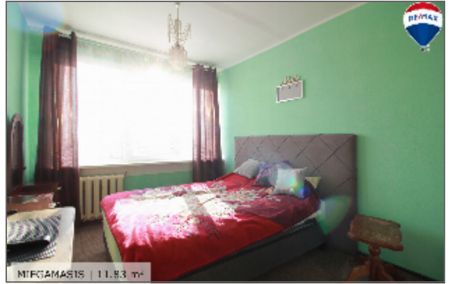
MIFGAMASTIS | 11.83 m 2