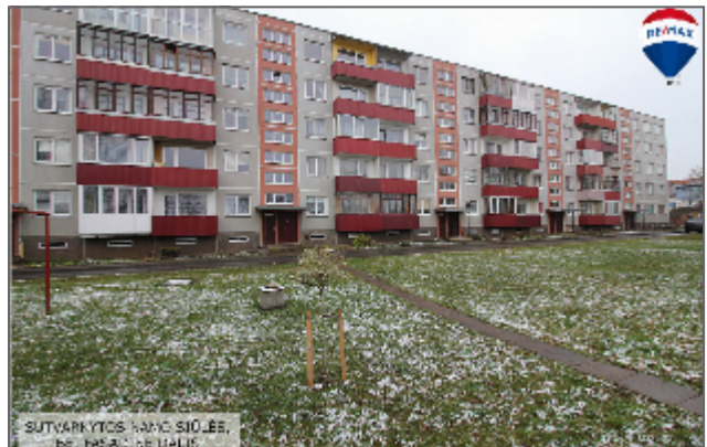
SUTVARKYTOS NAMO SIOJES. BE BISAUSIŲ DALIU