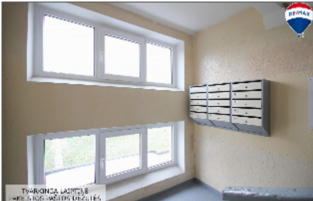
TVARKINCA LAIMTAS KABE SIOJIMO DESULES