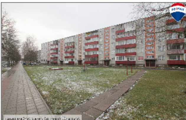
LABAI MAŽOS NAMO ŠILYBĖS ISLAUKOS