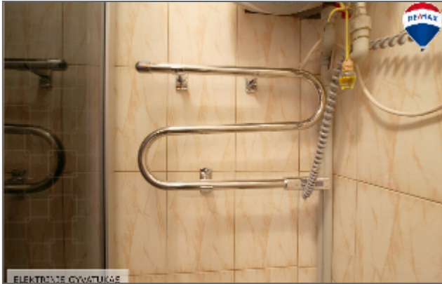
ELEKTRINĖ ŠILUMŲ KŪRKLĖ