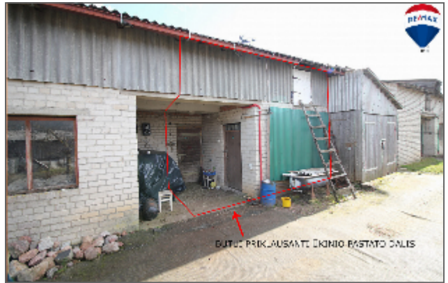
BUTŲ PRIKLAUSANTI EKONOMO BASTAMO DALIS