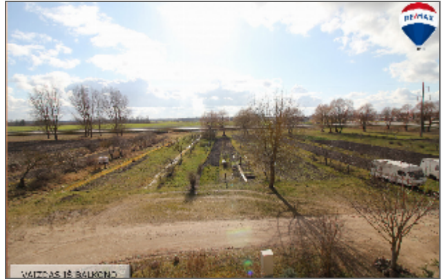
VAIZDAS IŠ BALKONO