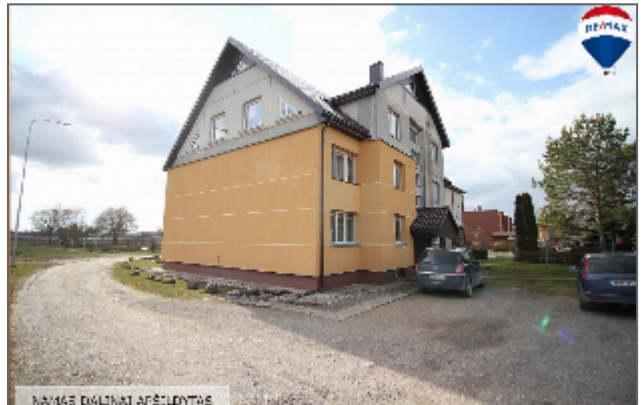
NAMŲ DALINAI APŠILDYTAS