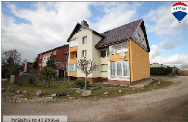
TVARKINGAS NAMO STOGAS