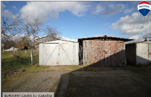
BUTŲ PRIKLAUSANTI GARAŽO DĖL