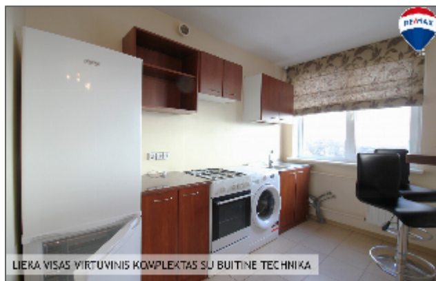
LIERA VISAS VIRTUVINIS KOMPLEKTAS SU BUITINE TECHNIKA