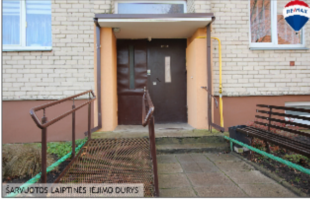
ŠARVUOTOS LAIPTINĖS ĮEJIMO DURYS