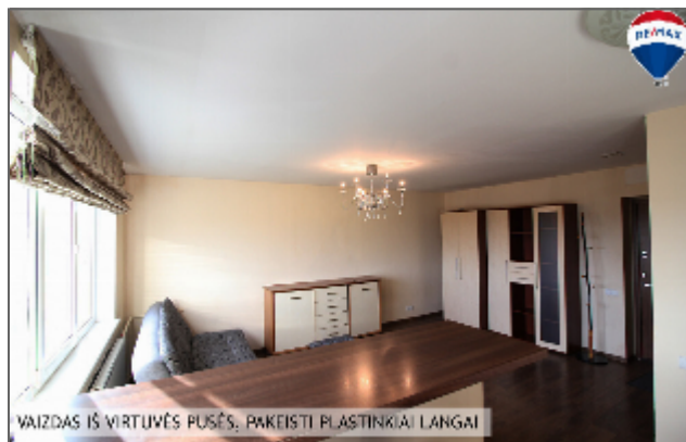
VAIZDAS IŠ VIRTUVĖS PUSĖS, PAKĖISTI PLASTIKINIAI LANGAI