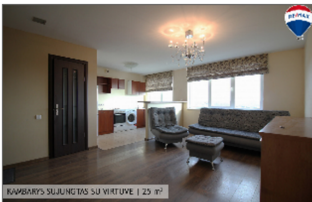
KAMBARYS SUJUNGTAS SU VIRTUVE | 25 m 2