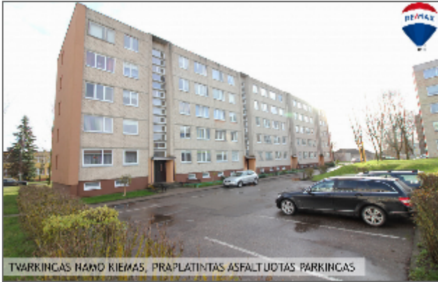
TVARKINGAS NAMO KIEMAS, PRAPLATINTAS ASFALTUOTAS PARKINGAS