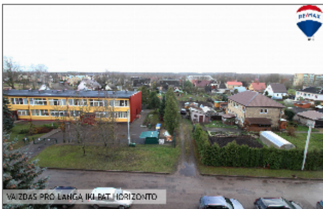
VAIZDAS PRO LANGĄ IKI PAT. HORIZONTO