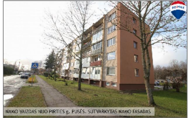
NAMO VAIZDAS NUO PIRTIES G., PUSĖS. SUTVARKYTAS NAMO FASADAS