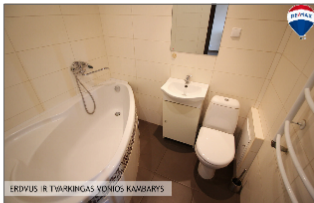
ERDVUS IR TVARKINGAS VONIOS KAMBARYS