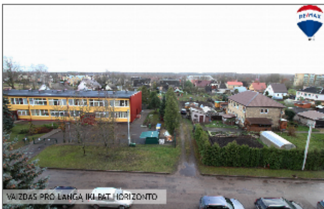
VAIZDAS PRO LANGĄ IKI PAT. HORIZONTO