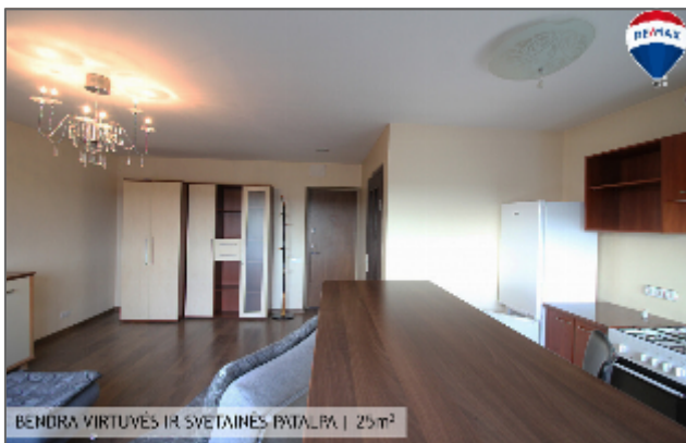
BENDRA VIRTUVĖS IR SVETAINĖS PATALPA | 25m 2