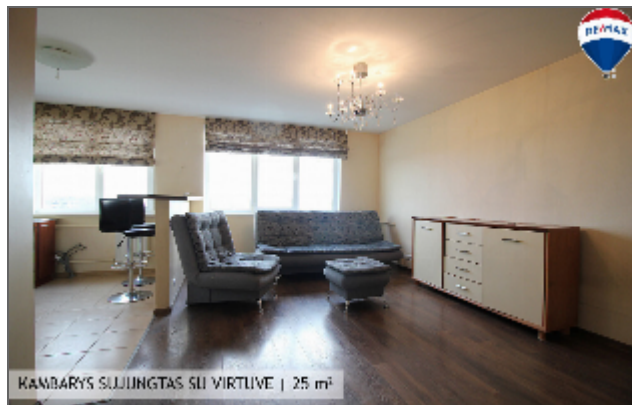
KAMBARYS SUJUNGTAS SU VIRTUVE | 25 m 2