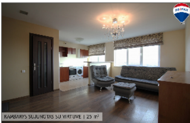
KAMBARYS SUJUNGTAS SU VIRTUVE | 25 m 2