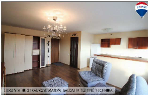
LIEKA VISI NULOTRAUKOSI MATOMI BALDAI IR BUITINĖ TECHNIKA