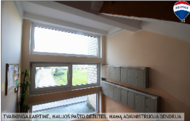
TVARKINGA LAIPTINE, NAUJOS PAŠTO DEŽUTĖS. NAMĄ ADMINISTRUOJIA BENDRŪJA