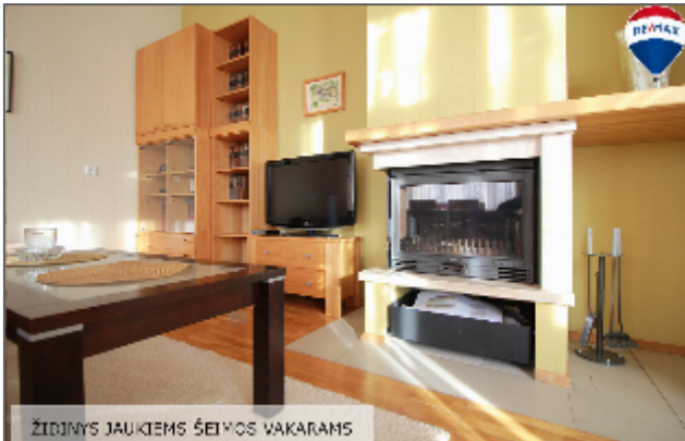
ŽIDINIYS JAUKIEMS ŠEIMOS VAKARAMS