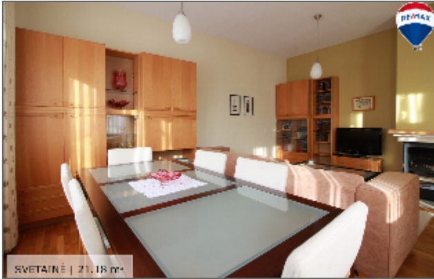
SVETAINĖ | 21.18 m 2