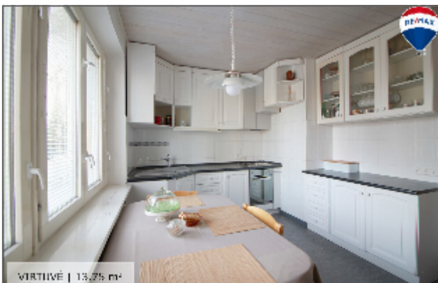
VIRTUVĖ | 13.75 m 2